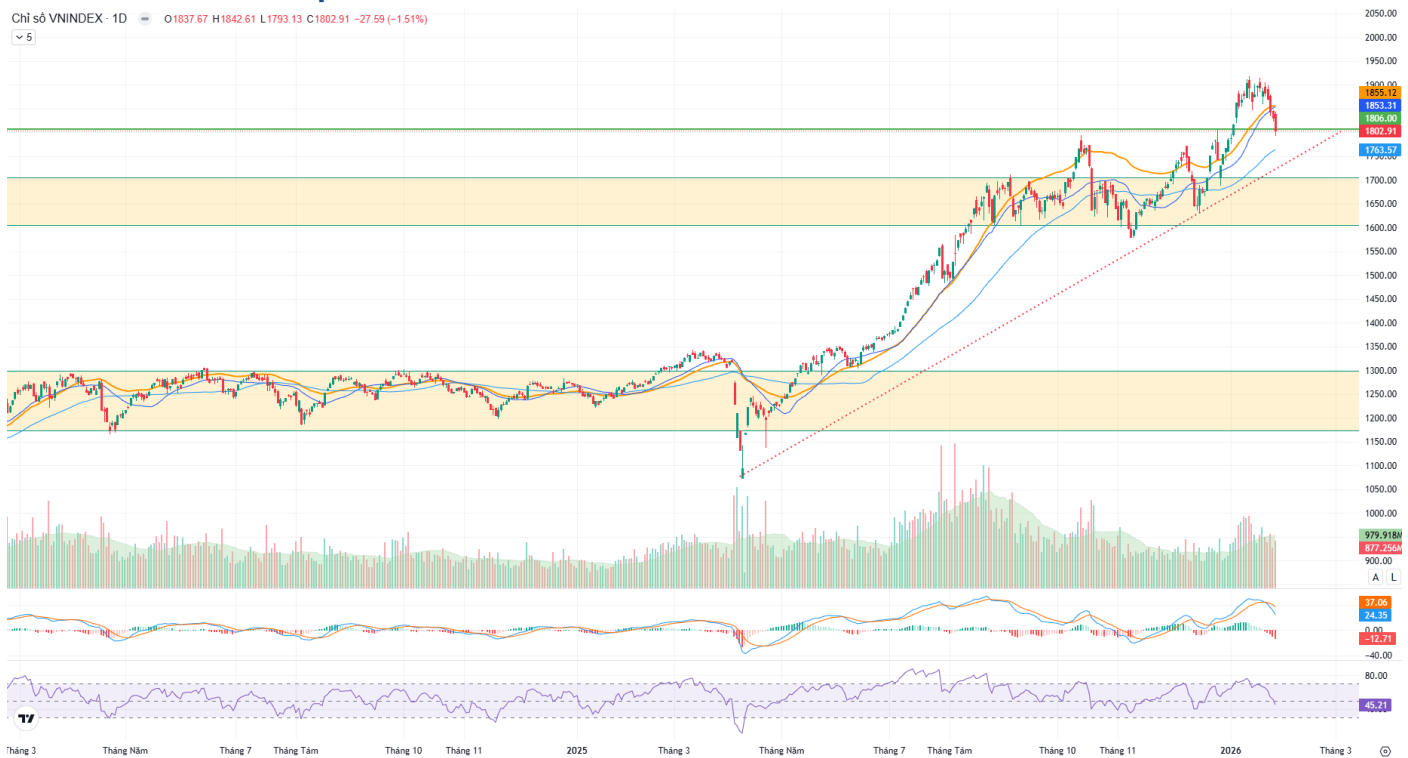
Hình 1: Đồ thị chỉ số VNIndex theo khung Daily

Chỉ số VNINDEX - 1D O 1837.67 H 1842.61 L 1793.13 C 1802.91 -27.59 (-1.51%)