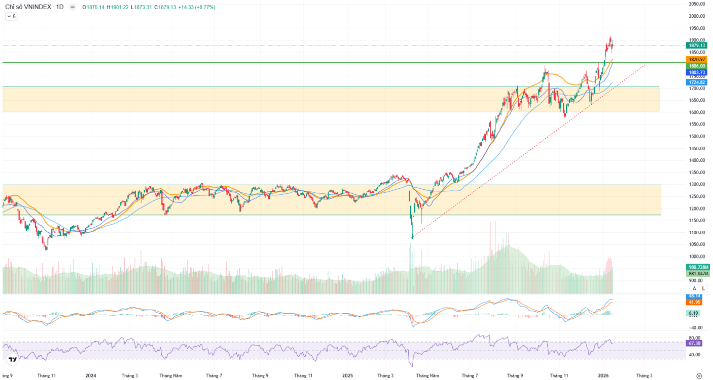
Hình 1: Đồ thị chỉ số VNIndex theo khung Daily

VN-Index ghi nhận giảm hơn 2 điểm, tuy nhiên kiểm định lại ngưỡng 1,900 lại rút chân xuống, đóng cửa tại 1,879.13 điểm. Thanh khoản duy trì trên mức trung bình 20 phiên. Đánh giá chỉ số hiện đã vượt qua ngưỡng đỉnh cũ, bứt phá lên trên vùng 1,850 – 1,880 điểm, đã chinh phục được ngưỡng 1,900 điểm, khả năng giằng co xảy ra để có thể kiểm tra lại vùng cầu quanh 1,830 – 1,880 điểm.