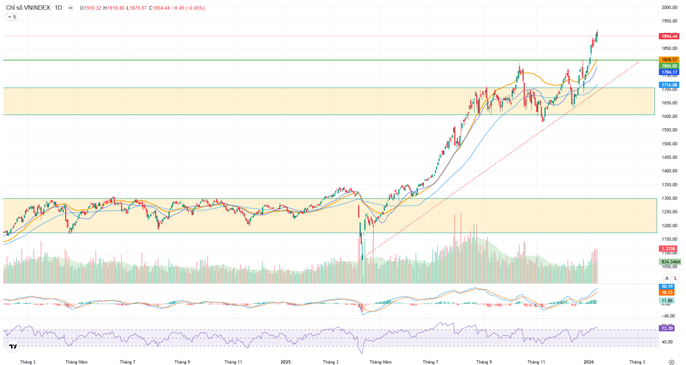
Hình 1: Đồ thị chỉ số VNIndex theo khung Daily

VN-Index ghi nhận giảm hơn 8 điểm, sau khi tiệm cận đến ngưỡng 1,918 điểm, đóng cửa tại 1,894.44 điểm. Thanh khoản duy trì trên mức trung bình 20 phiên. Đánh giá chỉ số hiện đã vượt qua ngưỡng đỉnh cũ, bứt phá lên trên vùng 1,850 – 1,880 điểm, đã chinh phục được ngưỡng 1,900 điểm, khả năng giảm co xảy ra để có thể kiểm tra lại vùng cầu quanh 1,830 – 1,880 điểm.