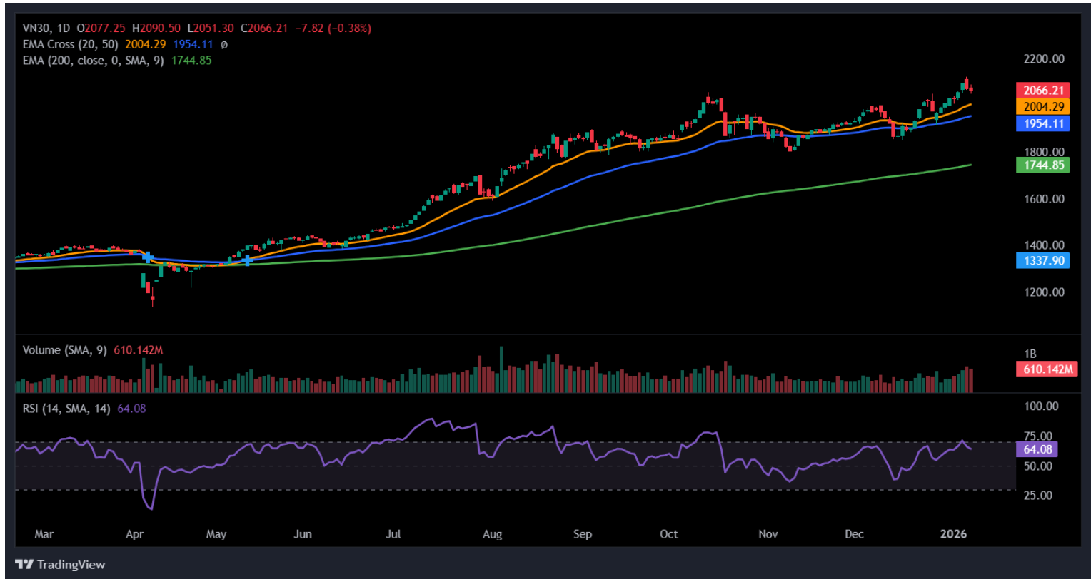
Hình 3- Chỉ số VN30 cơ sở theo ngày

Hiện tại, VN30-Index đang nằm trên đỉnh cũ tháng 10/2025 (tương đương vùng 2,010-2,055 điểm) đã bị phá vỡ. Đây sẽ là ngưỡng hỗ trợ quan trọng trong các phiên tới của chỉ số.