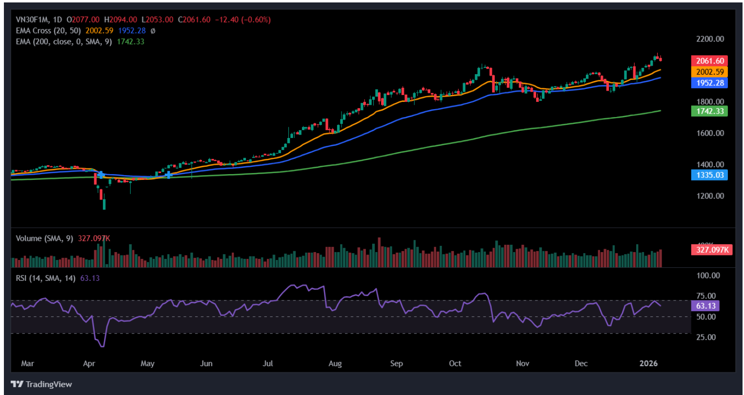
Hình 4- Chỉ số VN30F1M theo khung ngày