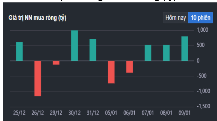
Hình 2- Giá trị Nước ngoài mua ròng (tỷ)