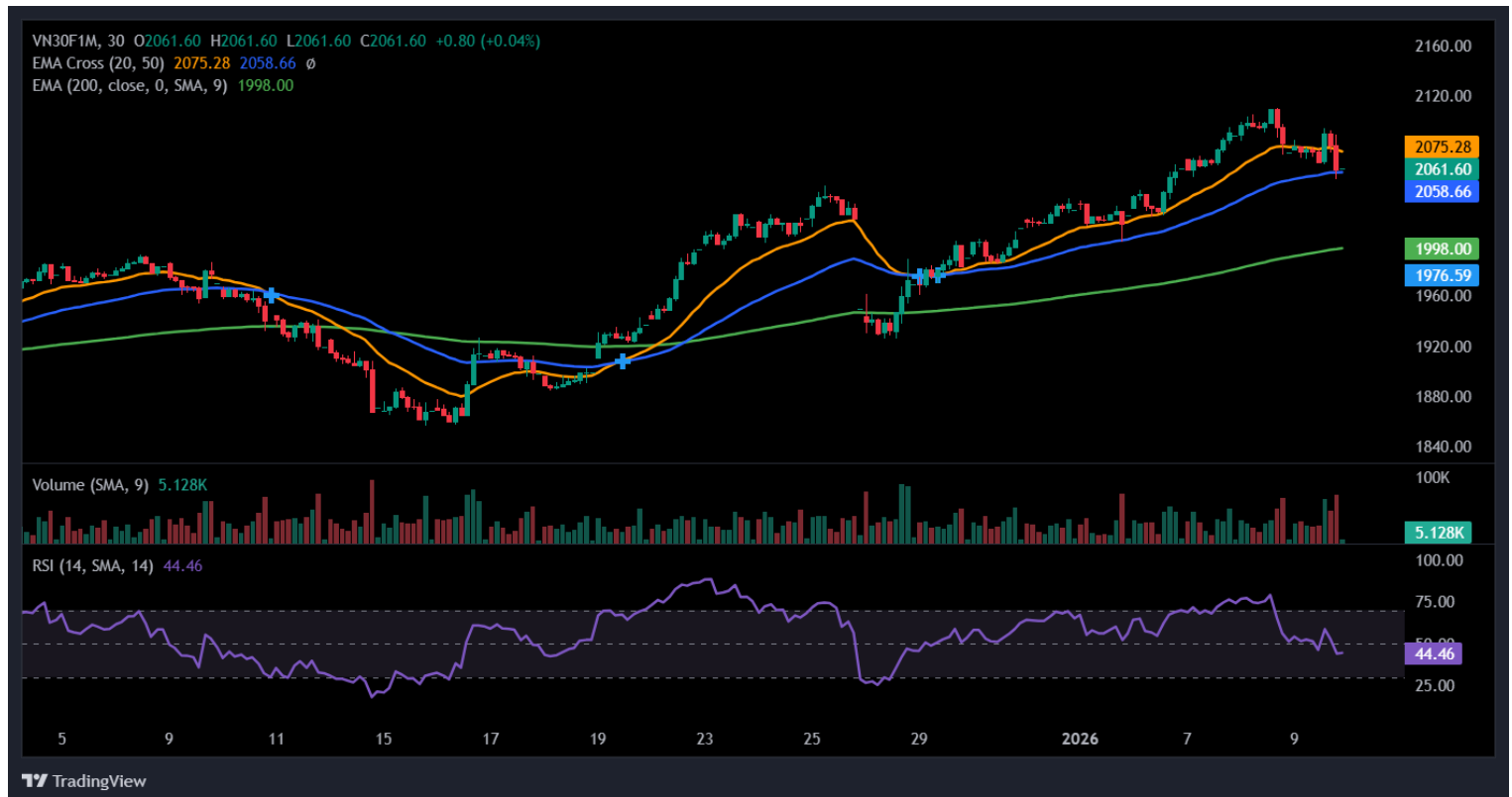
Hình 5- Chỉ số VN30F1M theo khung 30 phút