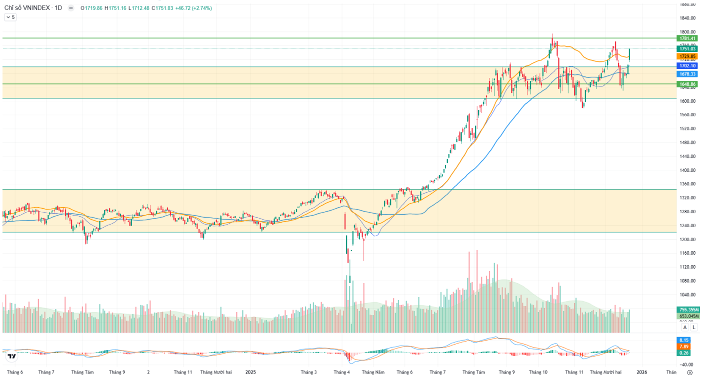
Hình 1: Đồ thị chỉ số VNIndex theo khung Daily

Chỉ số VNINDEX - 1D ▲ 1719.86 H1751.16 L1712.48 C1751.03 +46.72 (+2.74%) 5