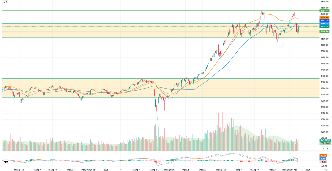
Hình 1: Đồ thị chỉ số VNIndex theo khung Daily

Chỉ số VNINDEX - 1D O 1647.42 H 1689.07 L 1629.37 C 1679.18 +33.17 (+2.02%)