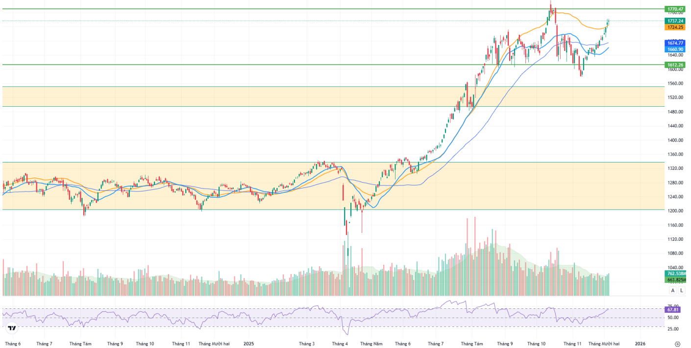
Hình 1: Đồ thị chỉ số VNIndex theo khung Daily

Chỉ số VNINDEX - 1D O 1735.41 H 1741.71 L 1725.23 C 1737.24 +5.47 (+0.32%)