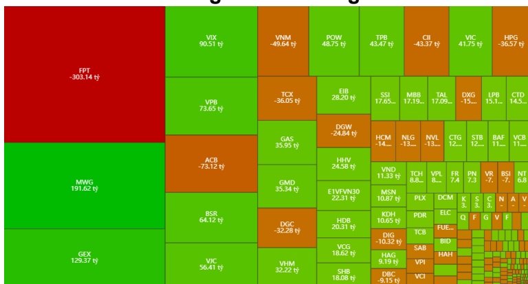
Hình 1- Phân bổ dòng tiền Nước ngoài