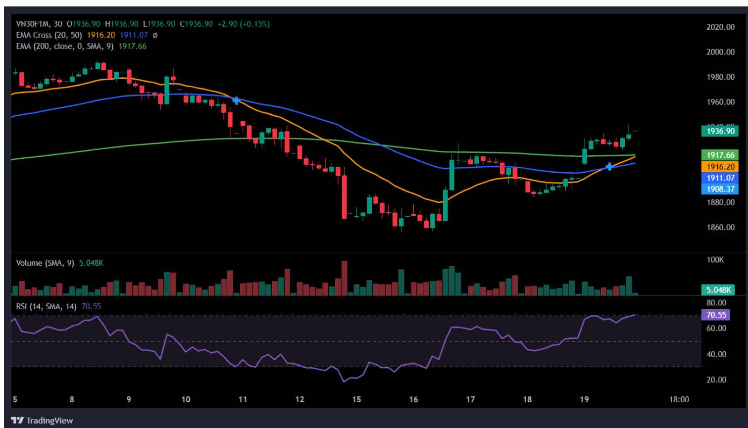
Hình 5- Chỉ số VN30F1M theo khung 30 phút