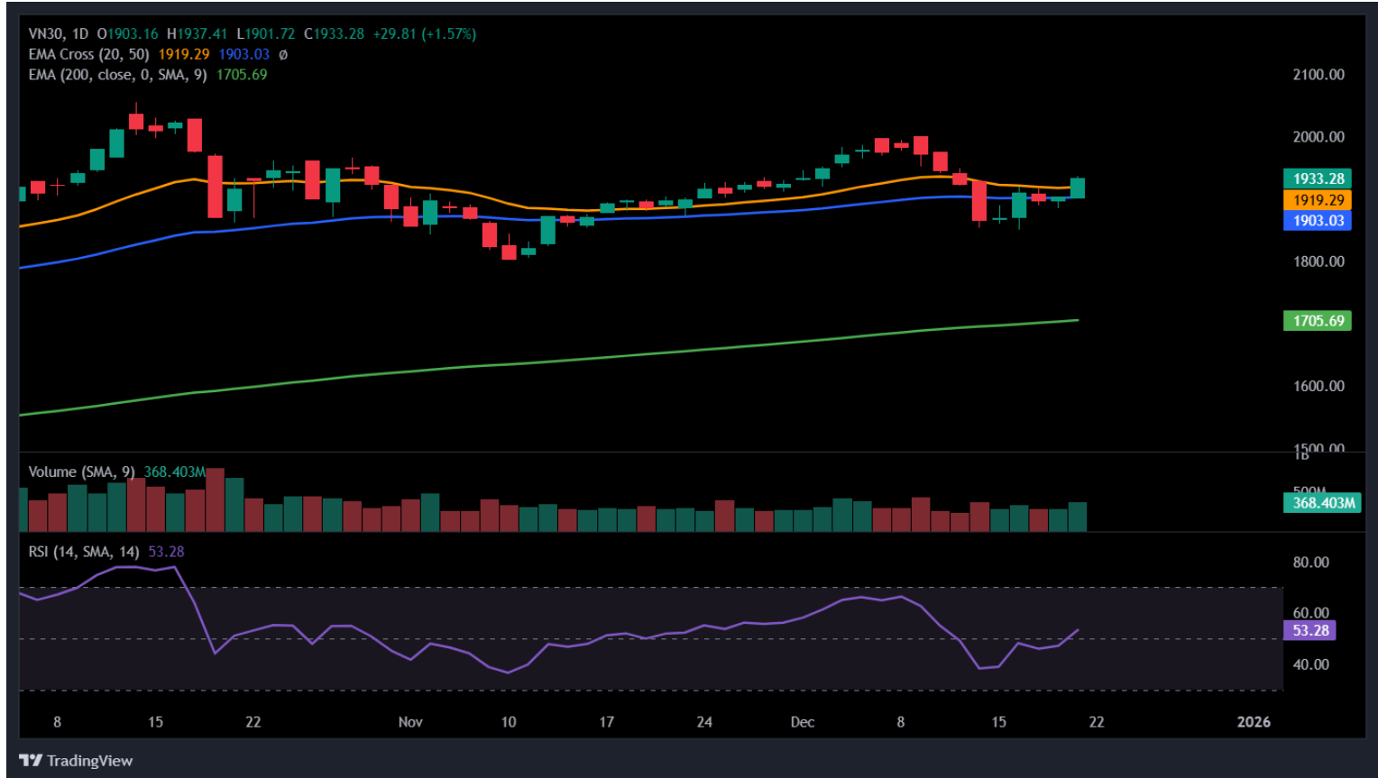
Hình 3- Chỉ số VN30 cơ sở theo ngày

Hiện tại, chỉ báo ADX tiếp tục vận động dưới mức 20 cho thấy xu hướng hiện tại vẫn còn rất yếu. Khả năng cao diễn biến đi ngang với các phiên tăng giảm đan xen sẽ còn xuất hiện trong các phiên tới.