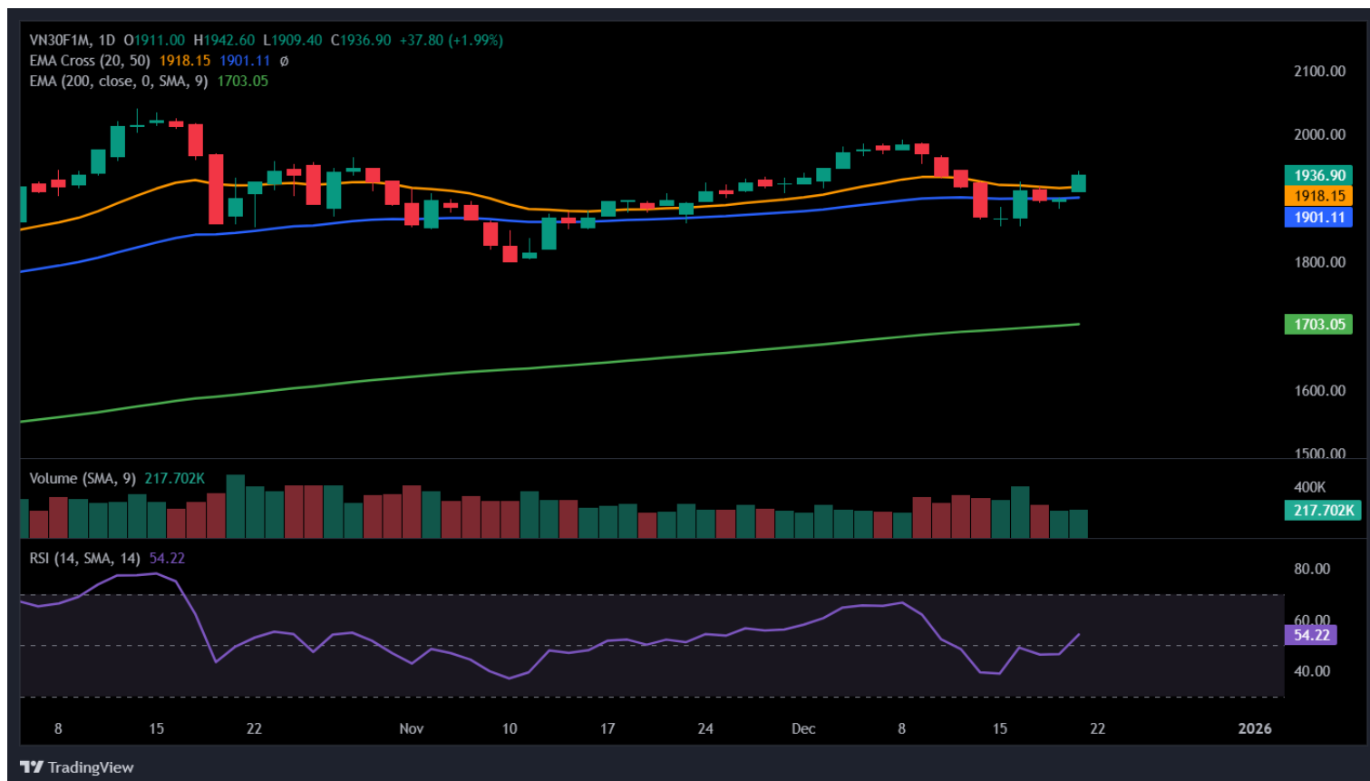
Hình 4- Chỉ số VN30F1M theo khung ngày