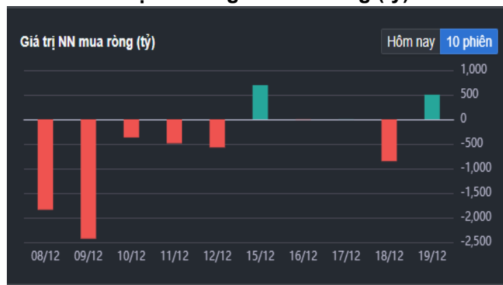
Hình 2- Giá trị Nước ngoài mua ròng (tỷ)