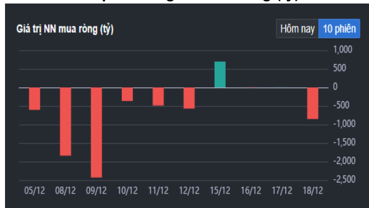
Hình 2- Giá trị Nước ngoài mua ròng (tỷ)