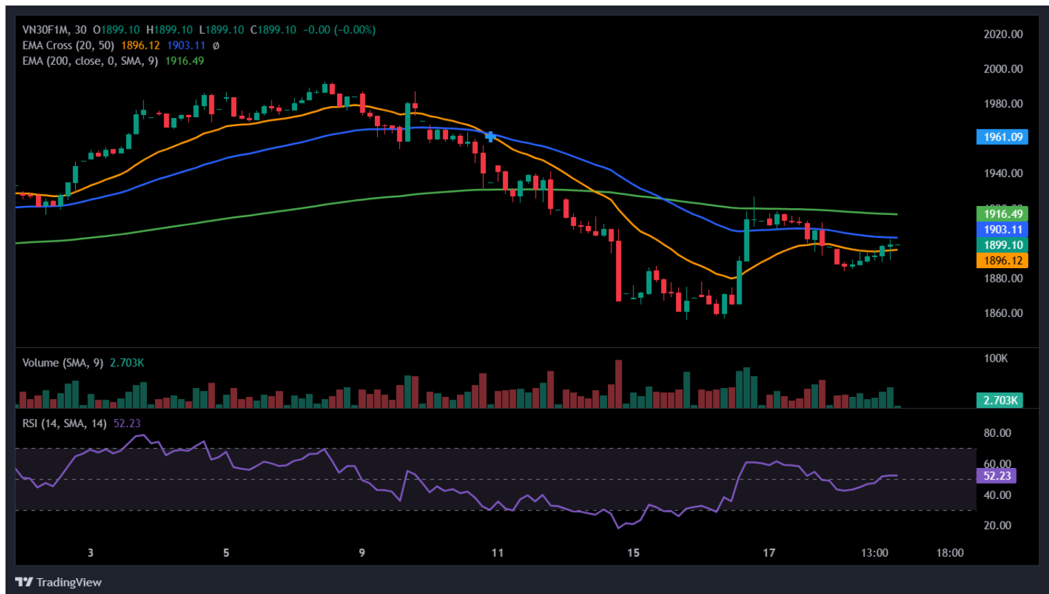
Hình 5- Chỉ số VN30F1M theo khung 30 phút