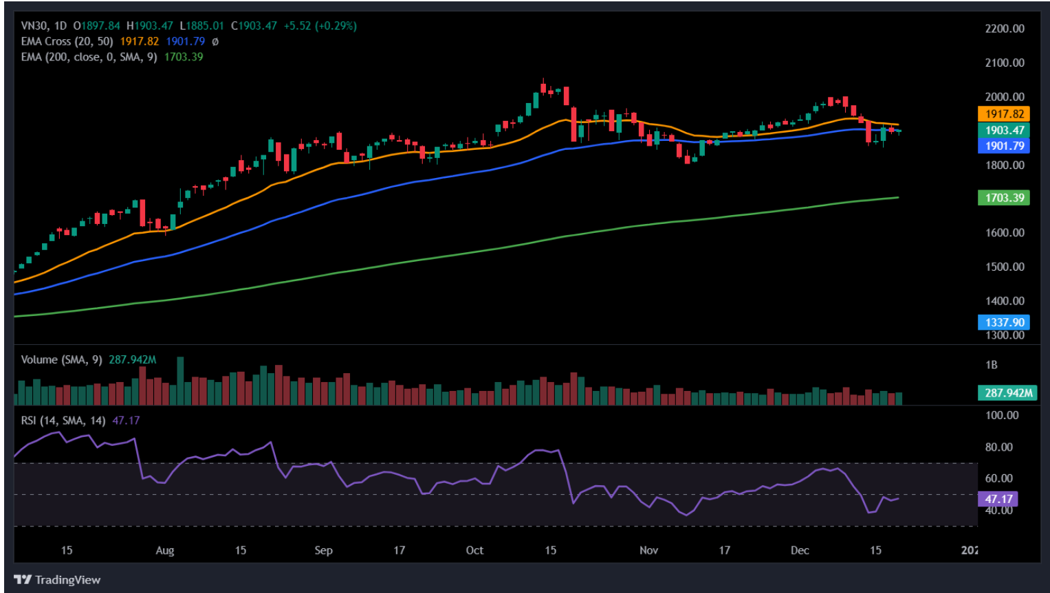
Hình 3- Chỉ số VN30 cơ sở theo ngày

Hiện tại, chỉ báo ADX tiếp tục vận động dưới mức 20 cho thấy xu hướng hiện tại vẫn còn rất yếu. Khả năng cao diễn biến đi ngang với các phiên tăng giảm đan xen sẽ còn xuất hiện trong các phiên tới.