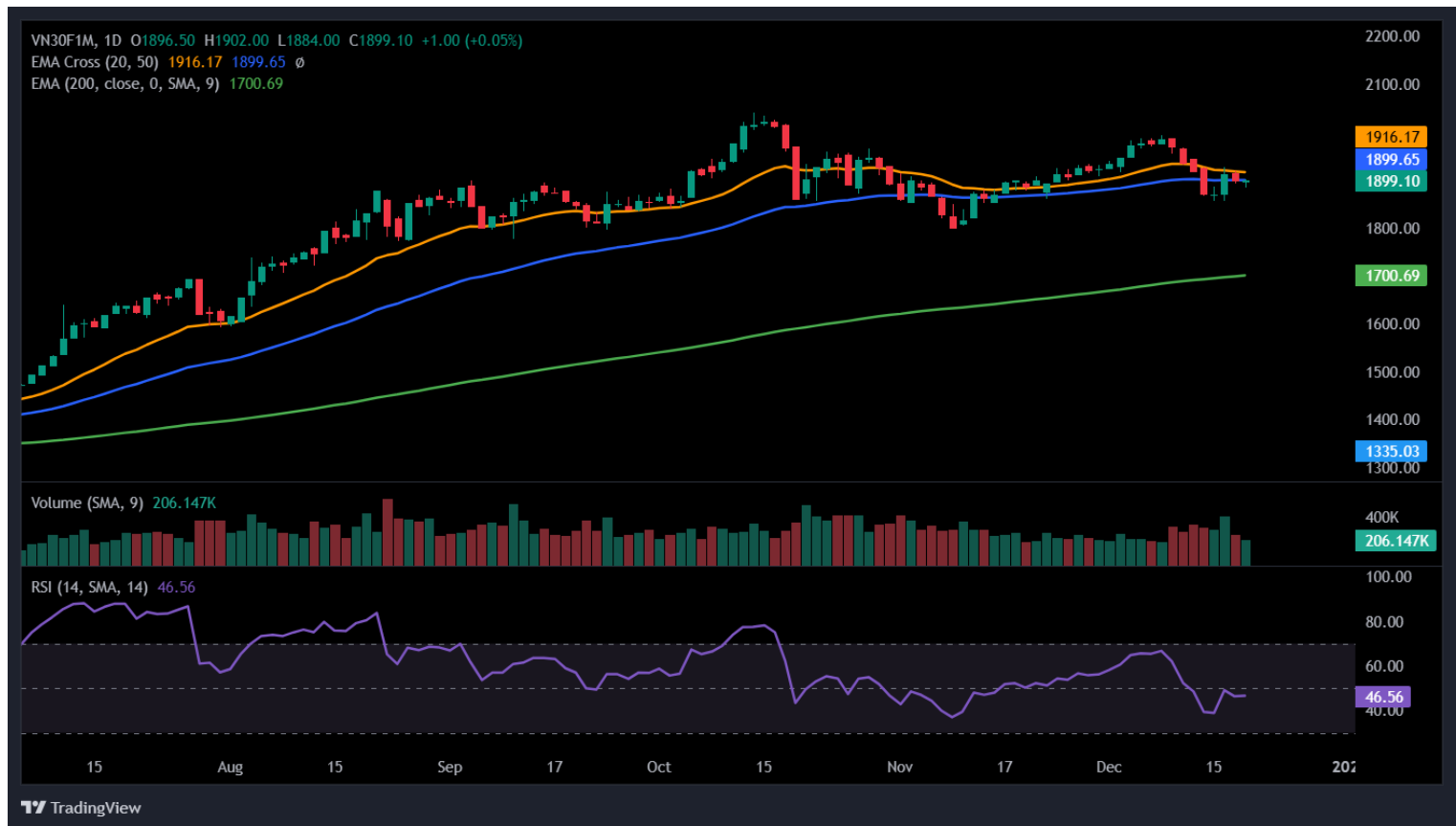
Hình 4- Chỉ số VN30F1M theo khung ngày