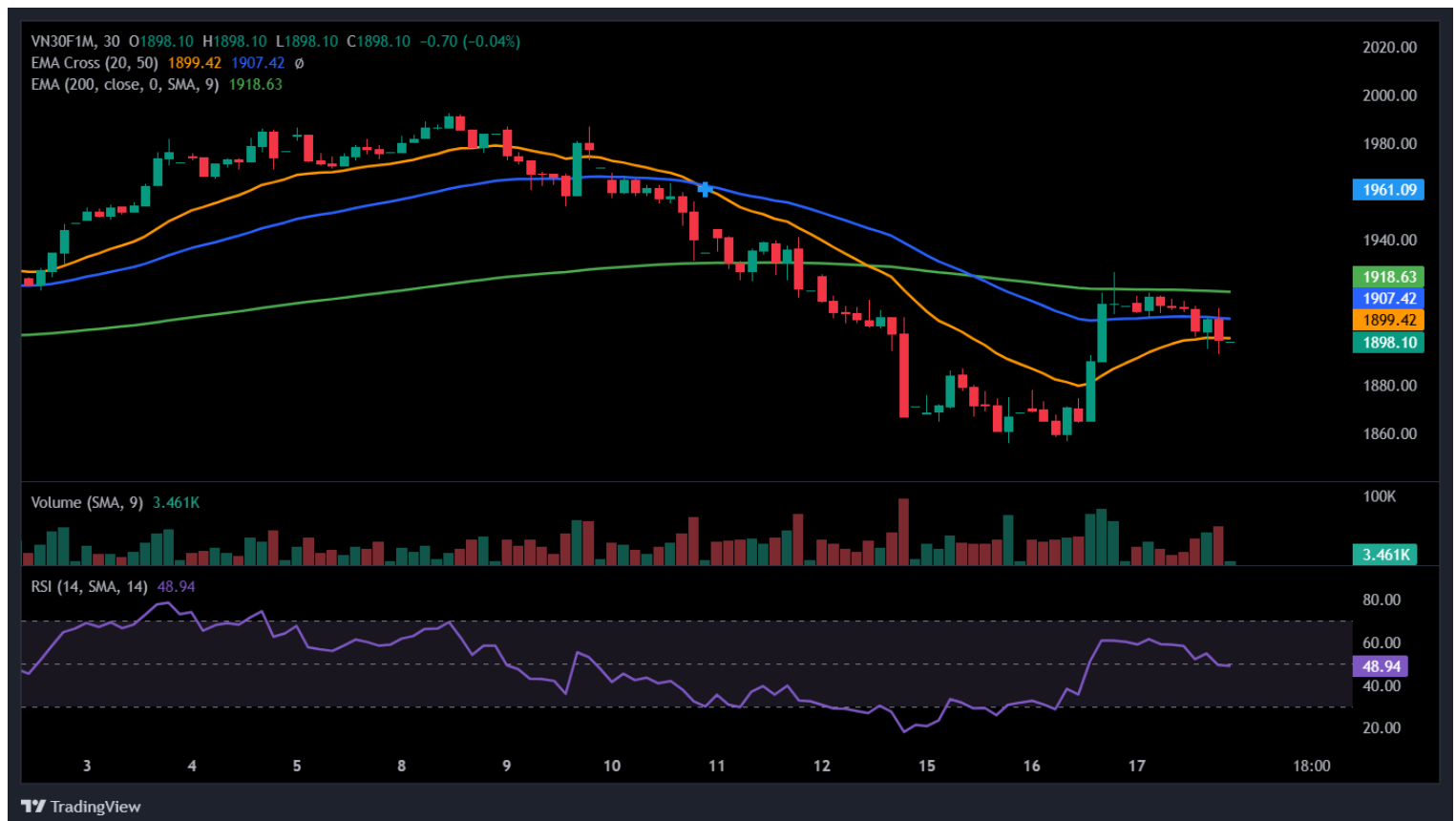
Hình 5- Chỉ số VN30F1M theo khung 30 phút