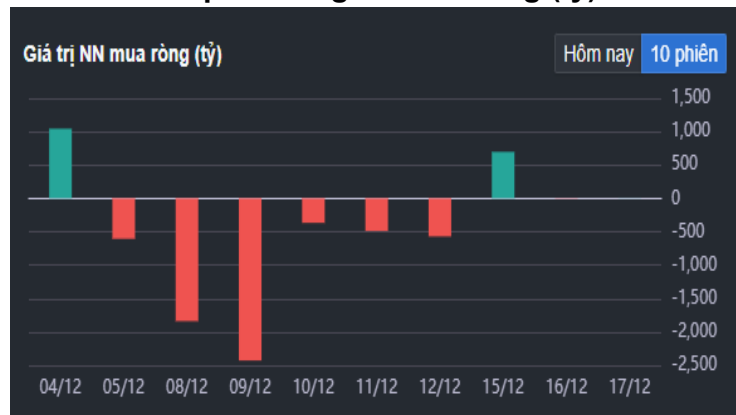
Hình 2- Giá trị Nước ngoài mua ròng (tỷ)