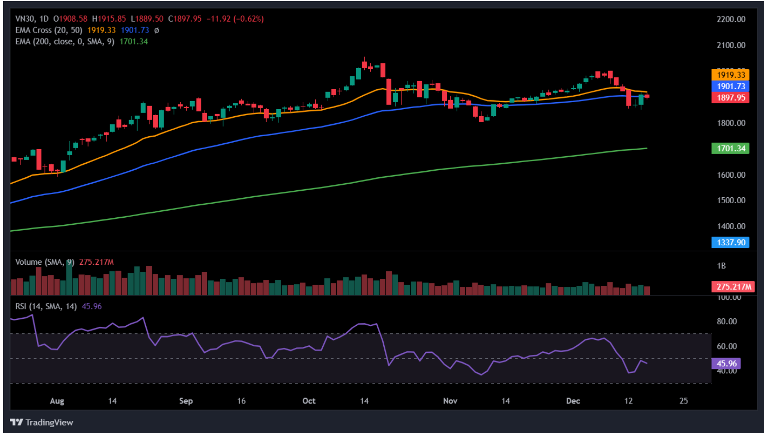
Hình 3- Chỉ số VN30 cơ sở theo ngày

Hiện tại, chỉ số tiếp tục nằm dưới đường Middle của Bollinger Bands trong khi khoảng cách giữa đường MACD với đường Signal ngày càng mở rộng sau khi cho tín hiệu bán và đang tiến về gần mức 0.