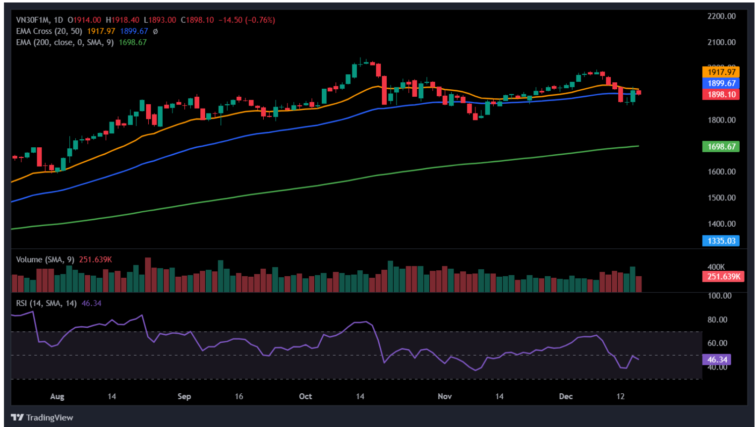
Hình 4- Chỉ số VN30F1M theo khung ngày