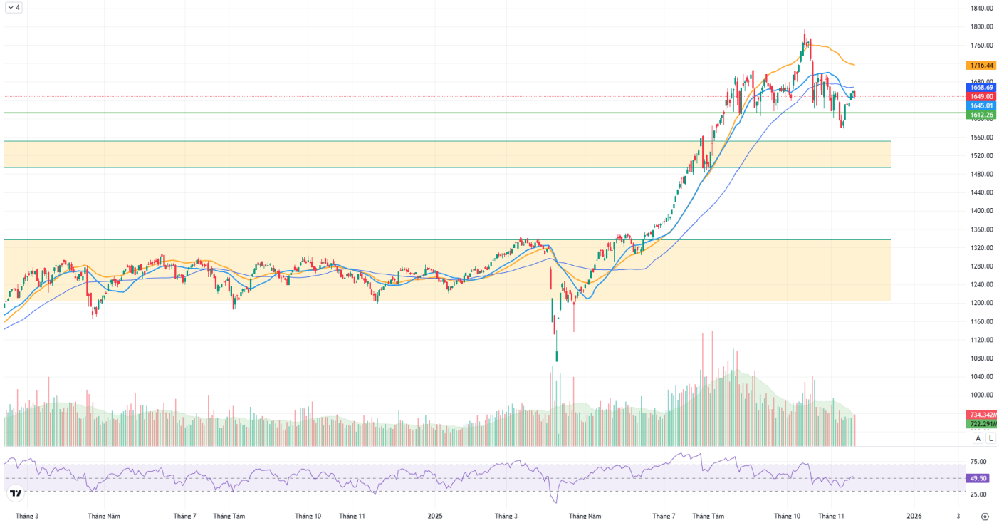
Hình 1: Đồ thị chỉ số VNIndex theo khung Daily

Chỉ số VNINDEX · 1D ● O 1659.25 H 1661.51 L 1643.04 C 1649.00 -10.92 (-0.66%)