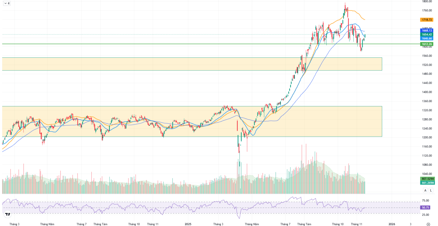
Hình 1: Đồ thị chỉ số VNIndex theo khung Daily

Chỉ số VNINDEX 1D O1640.47 H1654.68 L1640.47 C1654.42 +18.96 (+1.16%)