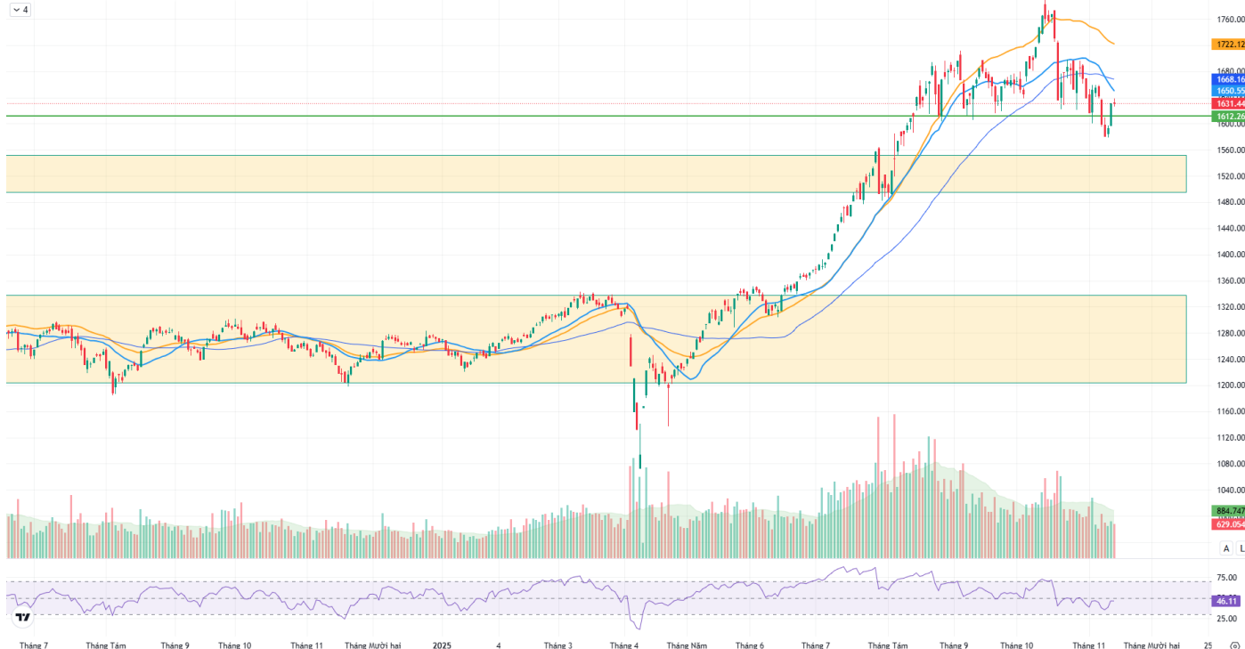
Hình 1: Đồ thị chỉ số VNIndex theo khung Daily

Chỉ số VNINDEX - 1D O 1632.64 H 1638.98 L 1625.94 C 1631.44 -0.42 (-0.03%)