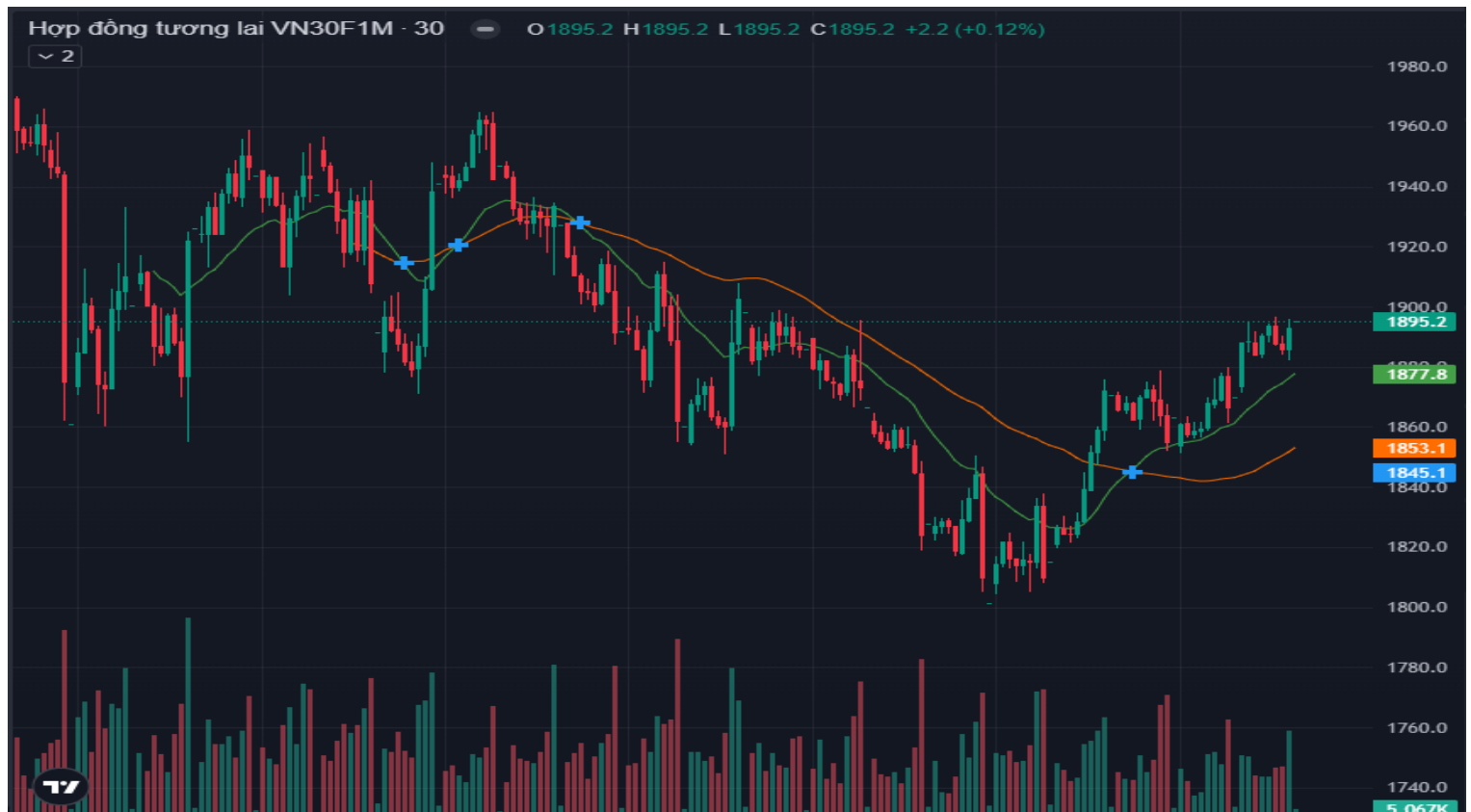
Hình 5- Chỉ số VN30F1M theo khung 30 phút