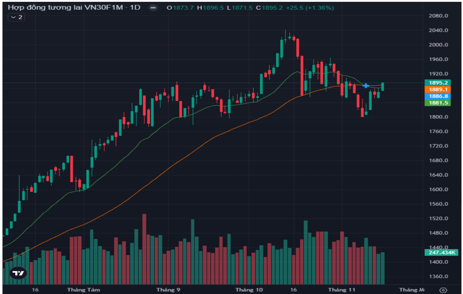
Hình 4- Chỉ số VN30F1M theo khung ngày