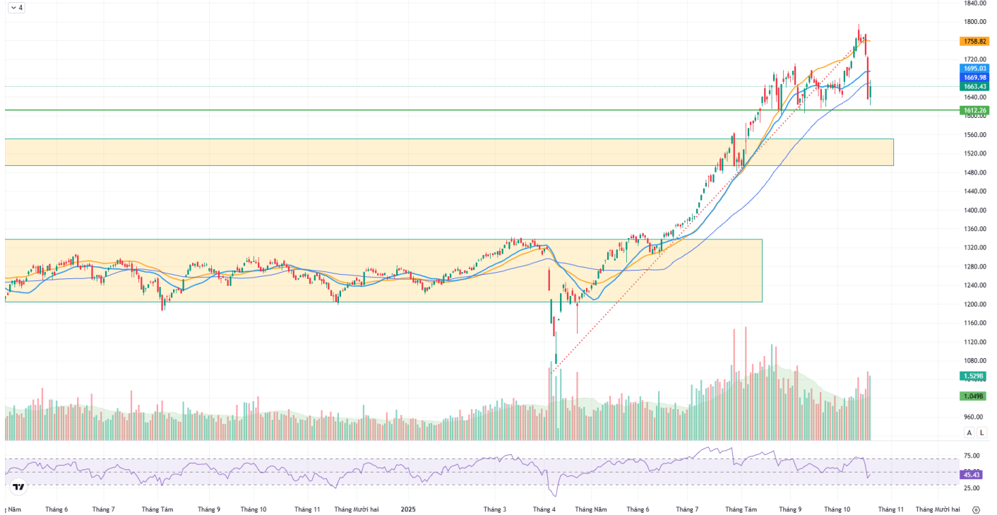
Hình 1: Đồ thị chỉ số VNIndex theo khung Daily

Chỉ số VNINDEX - 1D O 1640.80 H 1677.11 L 1622.37 C 1663.43 +27.00 (+1.65%)