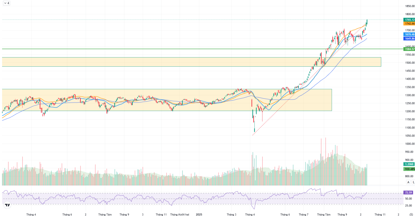
Hình 1: Đồ thị chỉ số VNIndex theo khung Daily

Chỉ số VNINDEX · 1D · O1738.23 H1766.77 L1736.03 C1765.12 +17.57 (+1.01%)