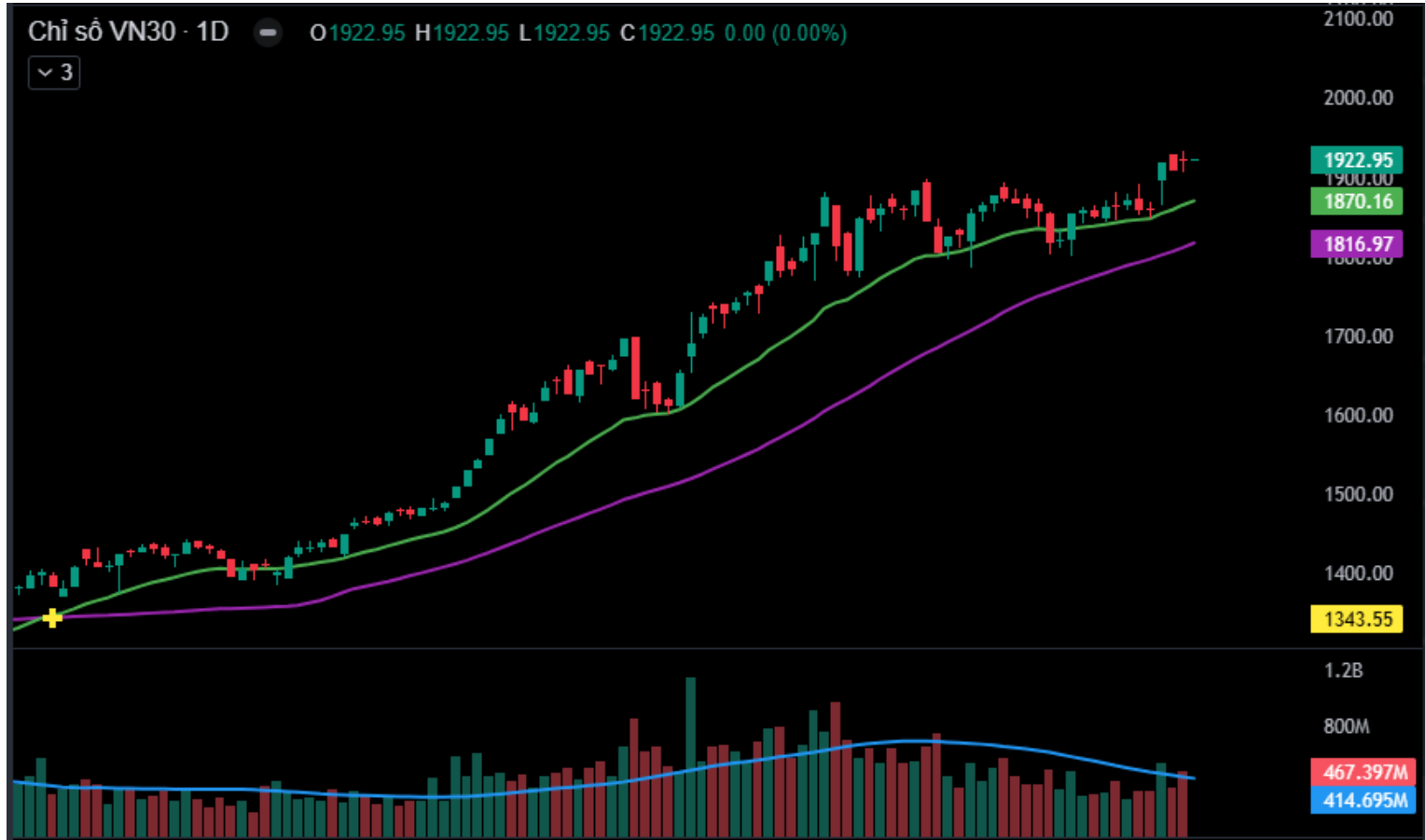
Hình 3- Chỉ số VN30 cơ sở theo ngày

Tuy nhiên, chỉ số tiếp tục bám sát dải trên (Upper Band) của Bollinger Bands trong khi chỉ báo MACD đã cho tín hiệu mua và tiếp tục tăng. Điều này cho thấy triển vọng tích cực vẫn đang hiện hữu.