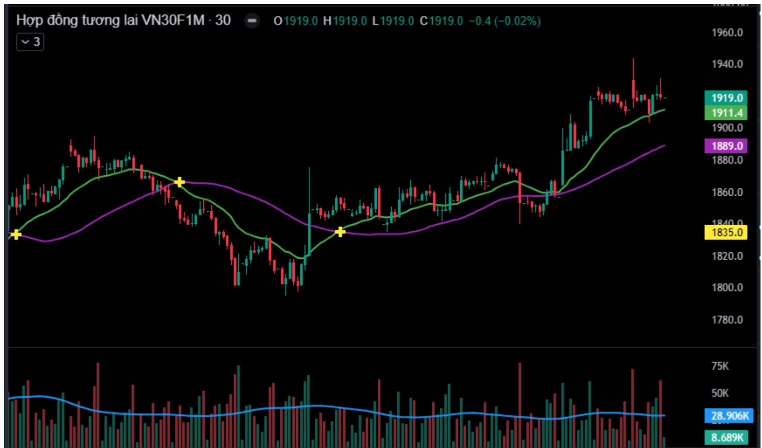
Hình 5- Chỉ số VN30F1M theo khung 30 phút