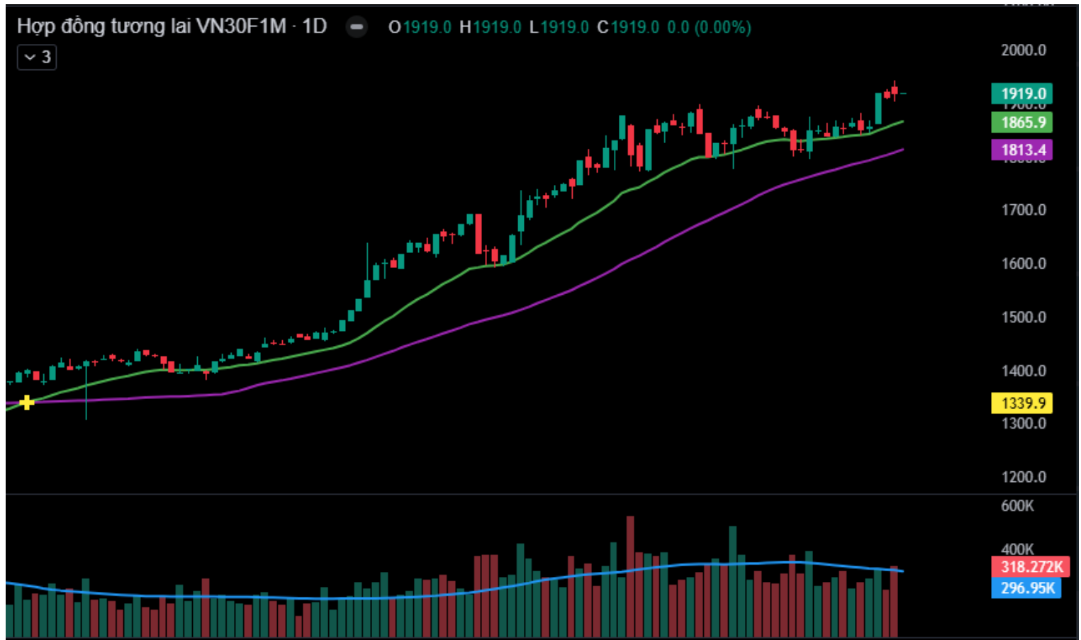
Hình 4- Chỉ số VN30F1M theo khung ngày