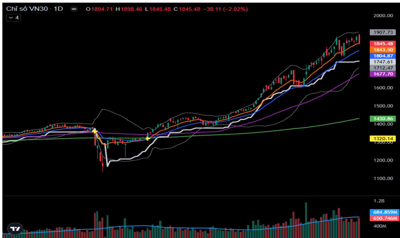
Hình 3- Chỉ số VN30 cơ sở theo ngày

Thêm vào đó, chỉ báo Stochastic Oscillator tiếp tục cắt xuống đường signal cho tín hiệu bán. Nhà đầu tư cần hạn chế mua đuổi khi VNI tiệm cận vùng cản tâm lý tại 1700 điểm.