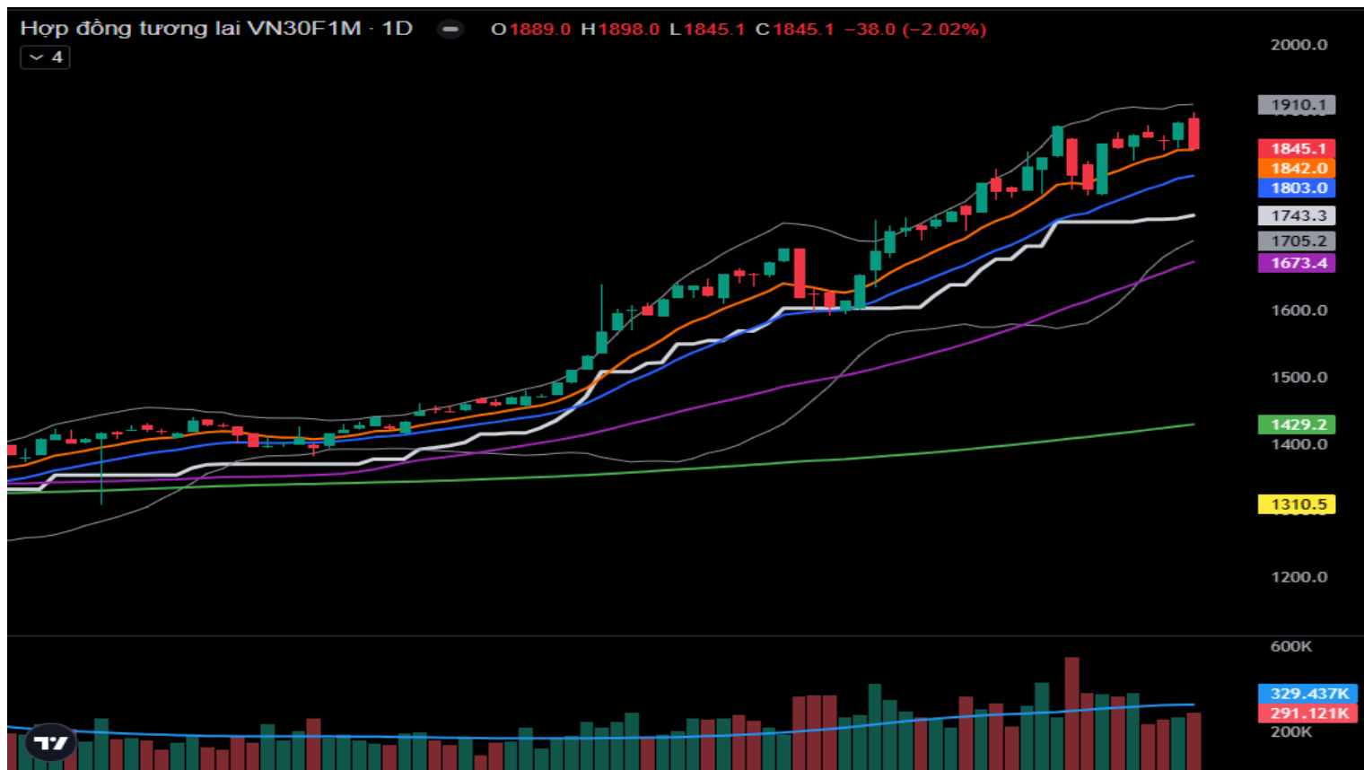
Hình 4- Chỉ số VN30F1M theo khung ngày