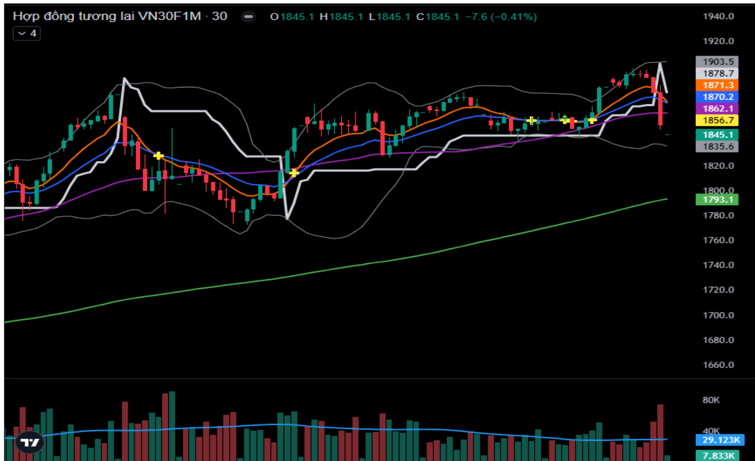
Hình 5- Chỉ số VN30F1M theo khung 30 phút