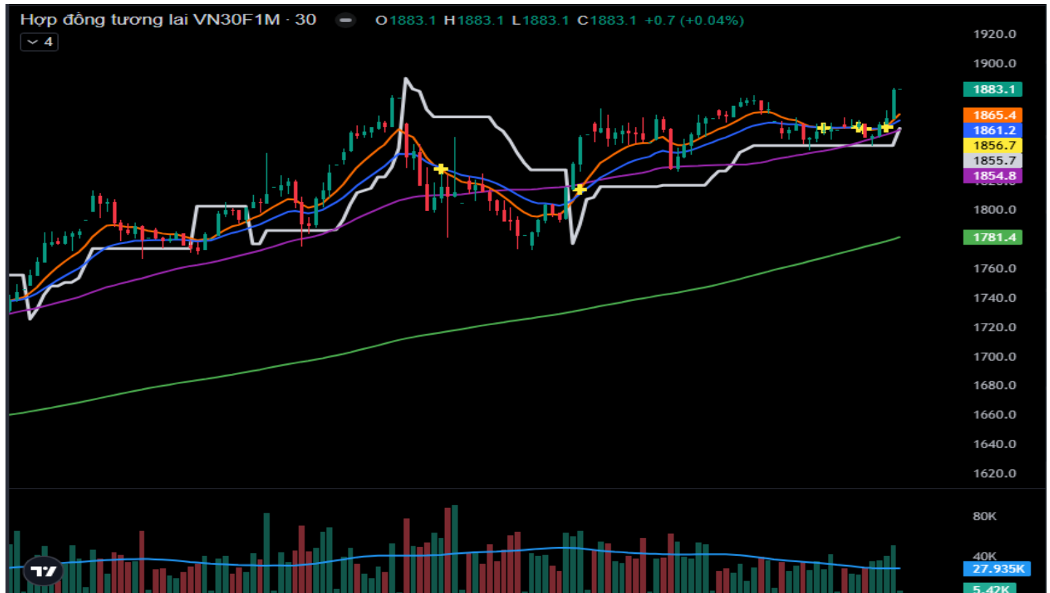
Hình 5- Chỉ số VN30F1M theo khung 30 phút