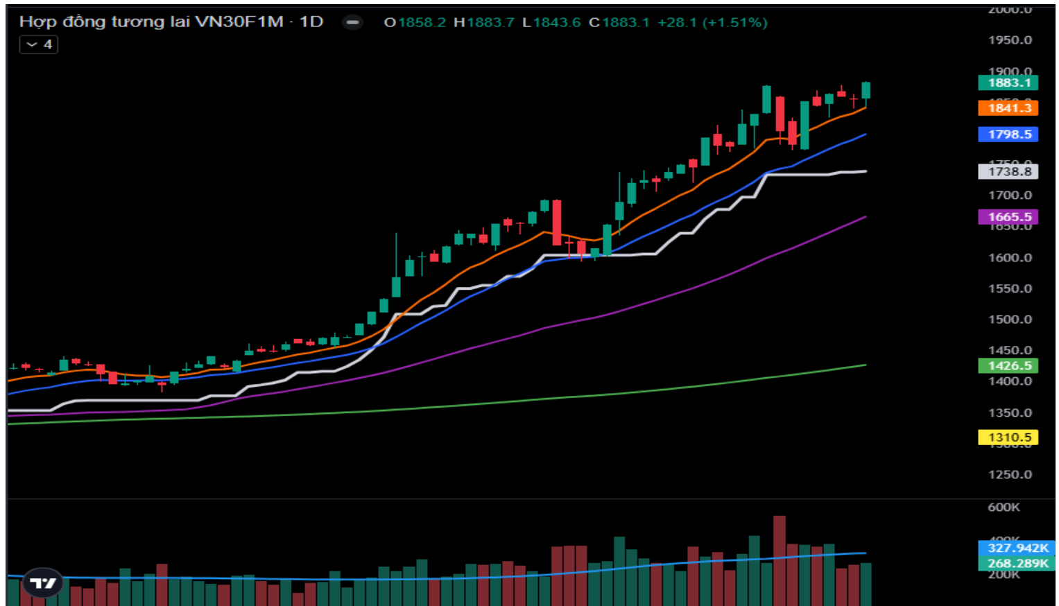
Hình 4- Chỉ số VN30F1M theo khung ngày