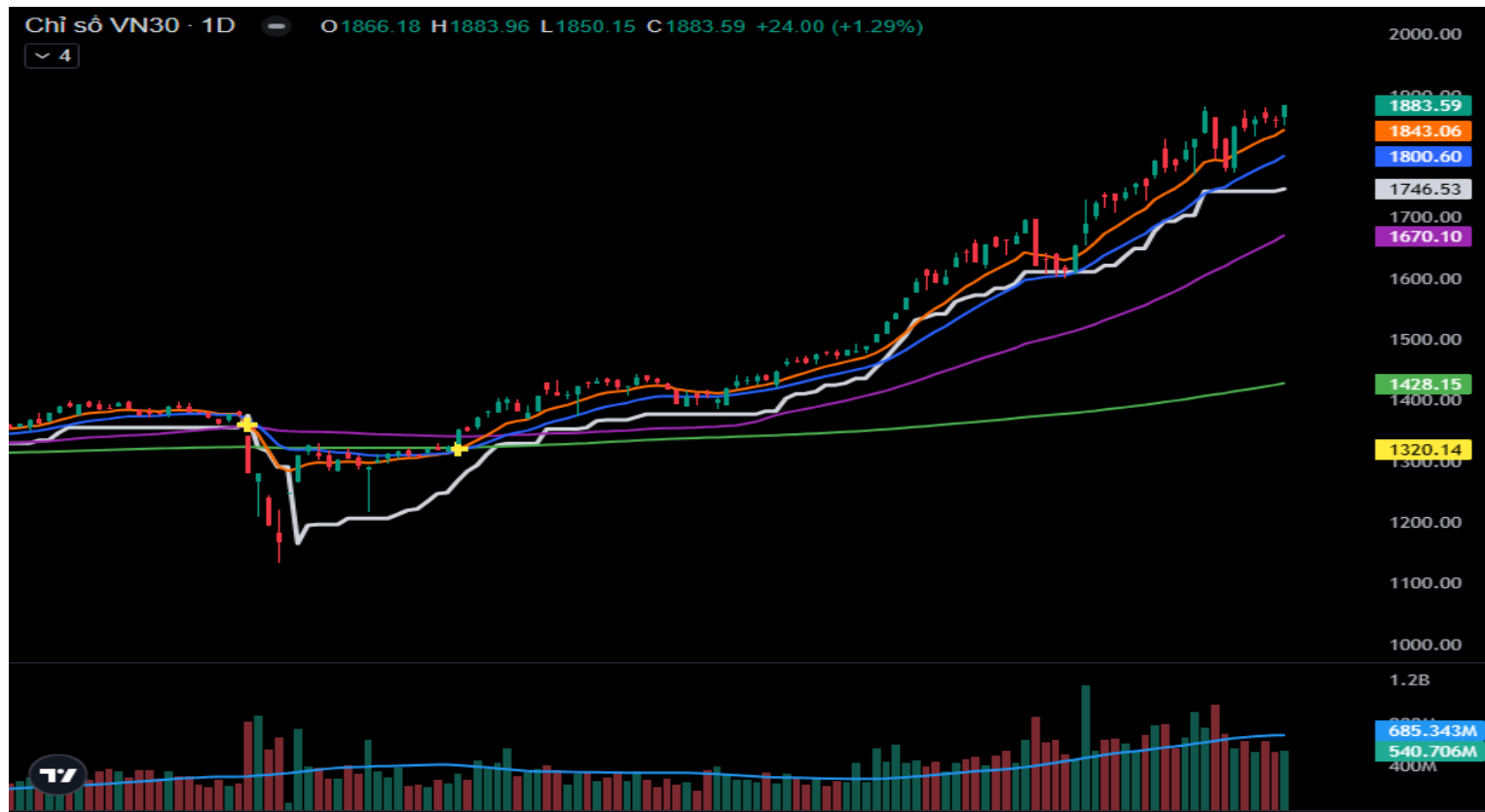
Hình 3- Chỉ số VN30 cơ sở theo ngày

Thêm vào đó, chỉ báo Stochastic Oscillator tiếp tục đi lên sau khi cho tín hiệu mua trở lại và ADX tiếp tục vận động trên mức 25 cho thấy xu hướng đang rất mạnh.