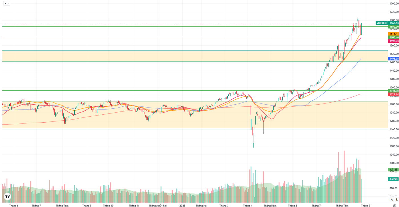
Hình 1: Đồ thị chỉ số VNIndex theo khung Daily

Chỉ số VNINDEX - 1D O 1611.61 H 1667.96 L 1603.73 C 1667.63 +53.60 (+3.32%)