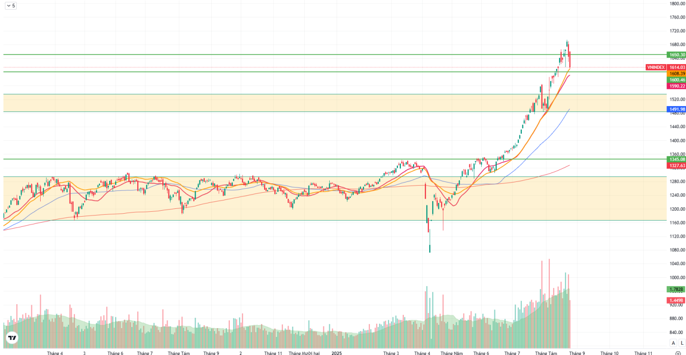
Hình 1: Đồ thị chỉ số VNIndex theo khung Daily

Chỉ số VNINDEX · 1D O 1659.70 H 1660.49 L 1608.53 C 1614.03 -31.44 (-1.91%)