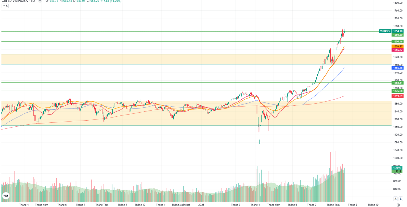
Hình 1: Đồ thị chỉ số VNIndex theo khung Daily

Chỉ số VNINDEX · 1D O 1646.73 H 1665.48 L 1643.04 C 1654.20 +17.83 (+1.09%)