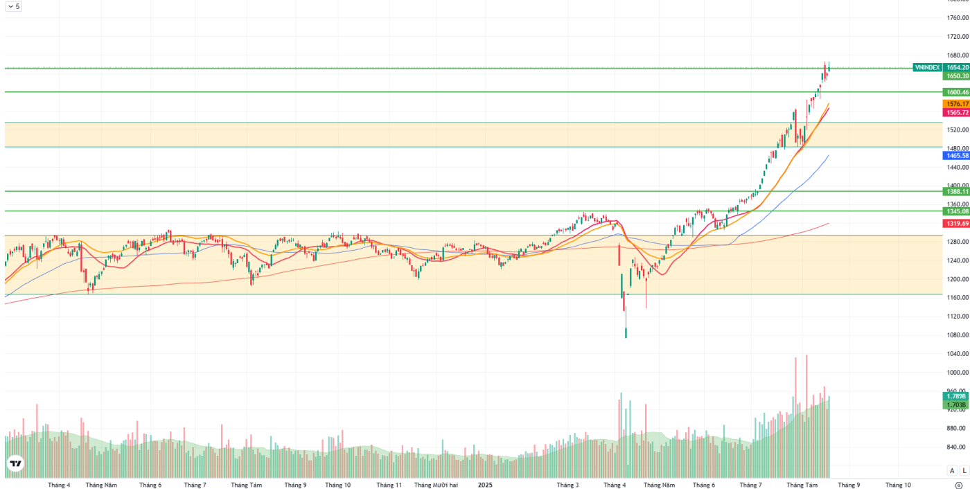
Hình 1: Đồ thị chỉ số VNIndex theo khung Daily

Chỉ số VNINDEX · 1D O 1646.73 H 1665.48 L 1643.04 C 1654.20 +17.83 (+1.09%)