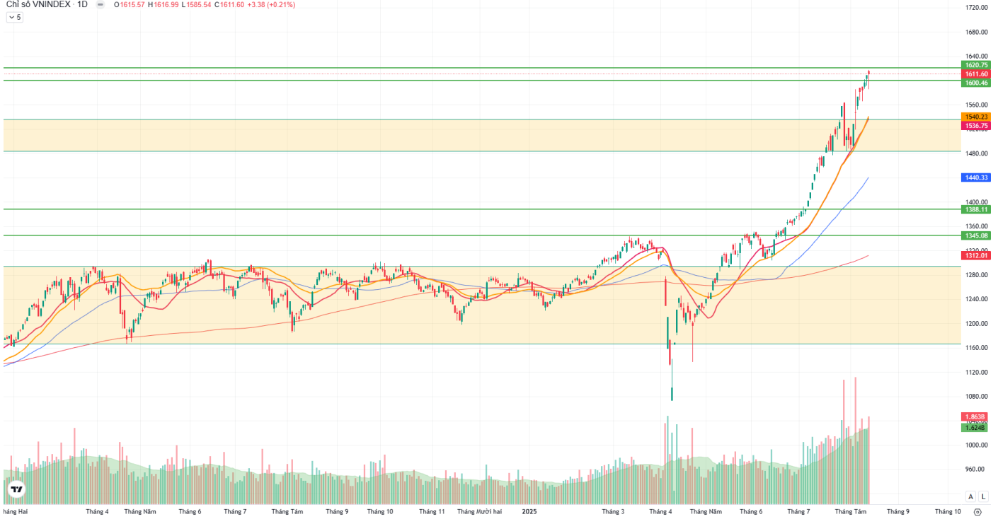
Hình 1: Đồ thị chỉ số VNIndex theo khung Daily

Chỉ số VNINDEX · 1D O 1615.57 H 1616.99 L 1585.54 C 1611.60 +3.38 (+0.21%)