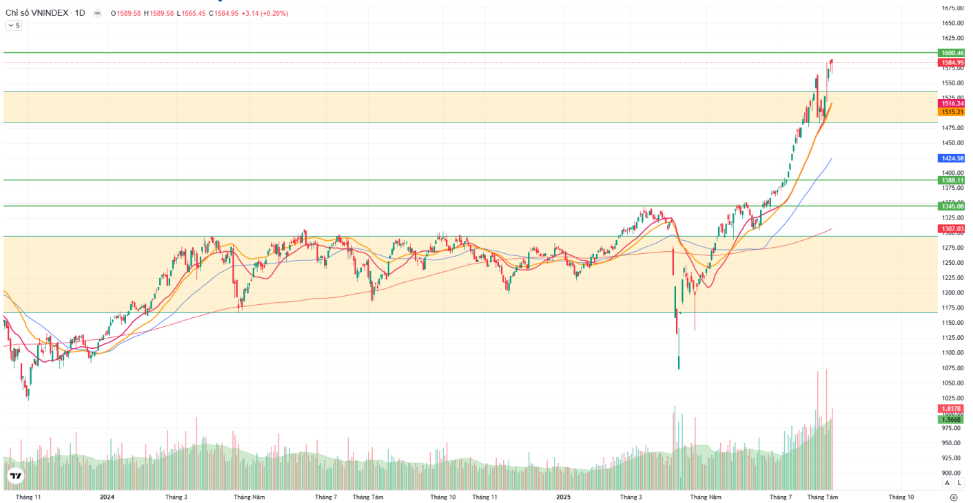
Hình 1: Đồ thị chỉ số VNIndex theo khung Daily

Chỉ số VNINDEX · 1D ○ 1589.58 H 1589.58 L 1565.45 C 1584.95 +3.14 (+0.20%)