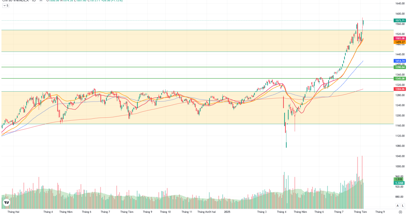
Hình 1: Đồ thị chỉ số VNIndex theo khung Daily

Chỉ số VNINDEX · 1D ○ 1558.56 H 1574.35 L 1551.60 C 1573.71 +26.56 (+1.72%) ▼ 5