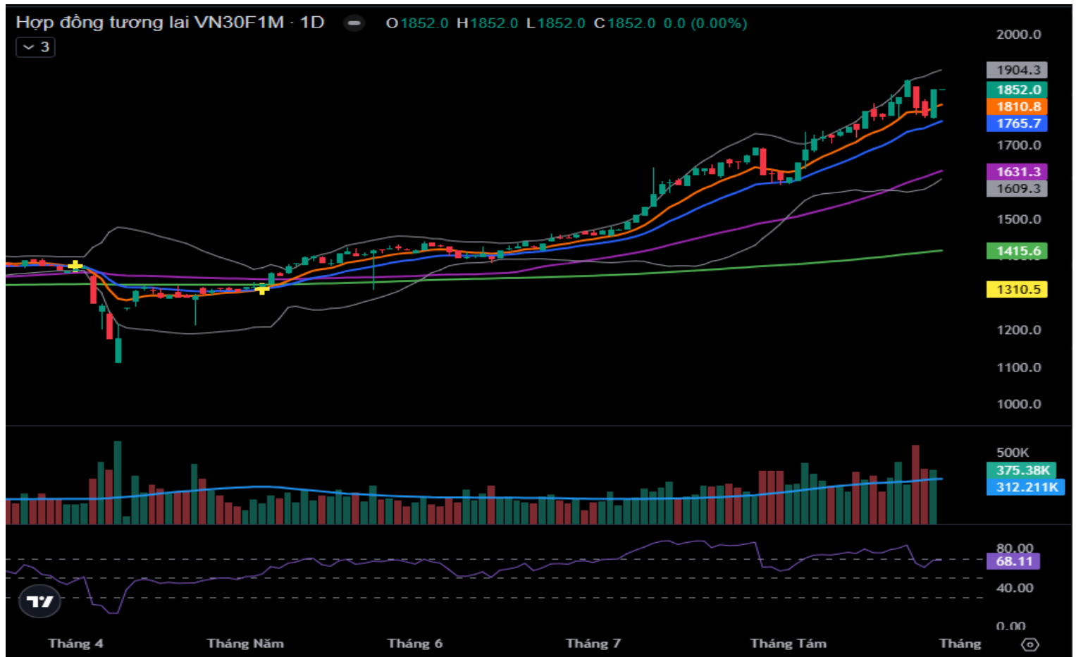
Hình 4- Chỉ số VN30F1M theo khung ngày