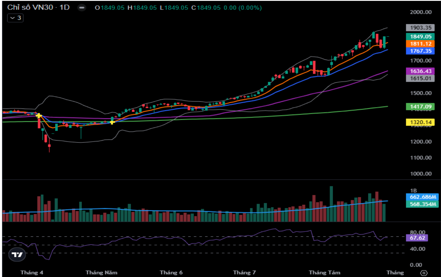
Hình 3- Chỉ số VN30 cơ sở theo ngày

Tuy nhiên, Stochastic Oscillator tiếp tục suy yếu sau khi cho tín hiệu bán trong vùng quá mua (Overbought). Nếu chỉ báo rời khỏi vùng này thì rủi ro điều chỉnh giảm trong ngắn hạn vẫn hiện hữu.