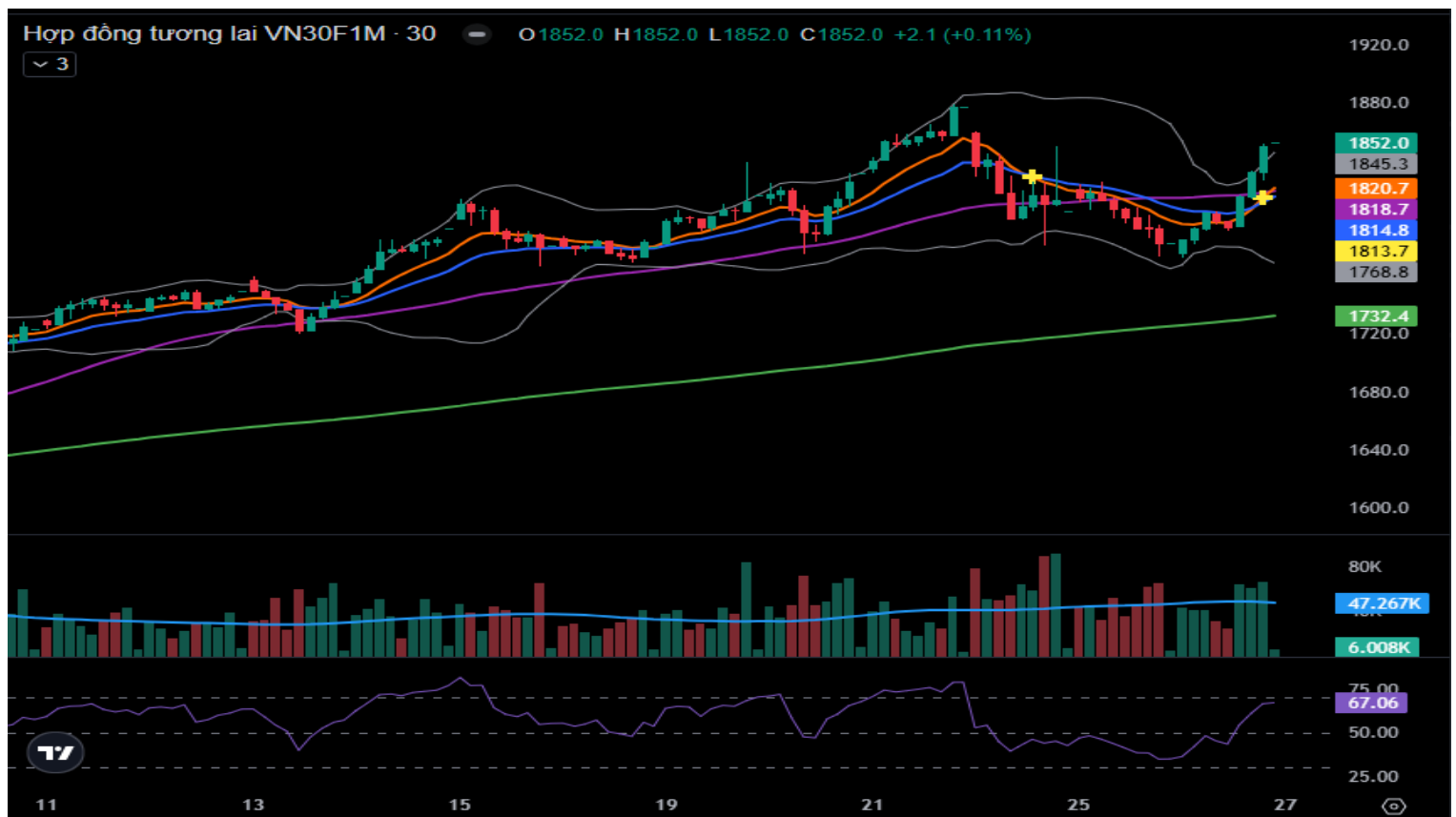
Hình 5- Chỉ số VN30F1M theo khung 30 phút