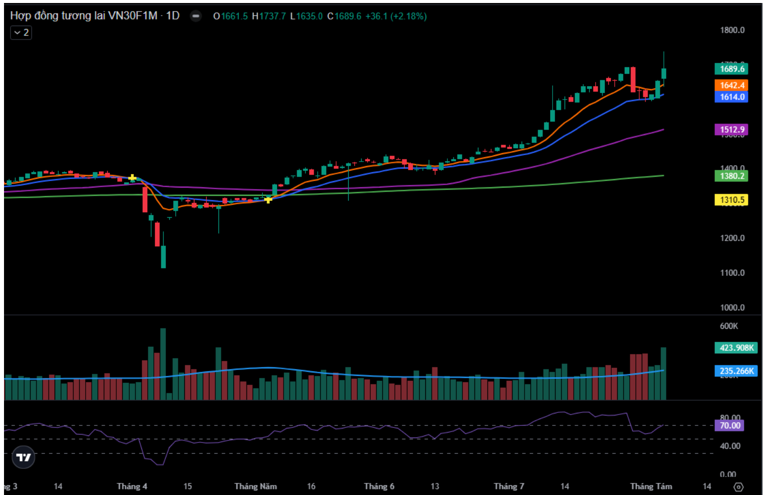
Hình 4- Chỉ số VN30F1M theo khung ngày