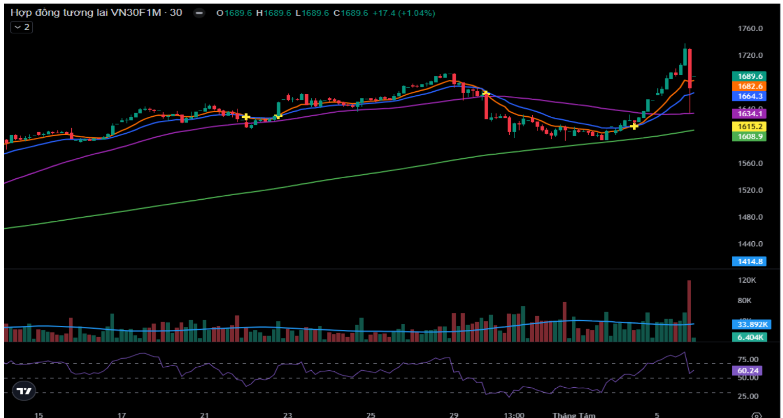
Hình 5- Chỉ số VN30F1M theo khung 30 phút