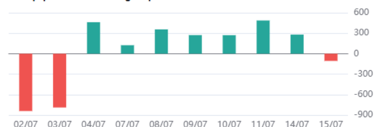
Giá trị tự doanh mua ròng 10 phiên

* Dữ liệu tự doanh được tổng hợp hàng ngày sau phiên giao dịch