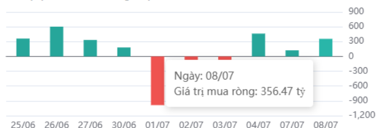
Giá trị tự doanh mua ròng 10 phiên

* Dữ liệu tự doanh được tổng hợp hàng ngày sau phiên giao dịch