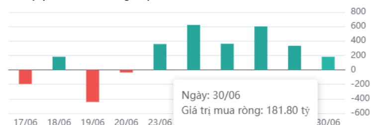
Giá trị tự doanh mua ròng 10 phiên

* Dữ liệu tự doanh được tổng hợp hàng ngày sau phiên giao dịch