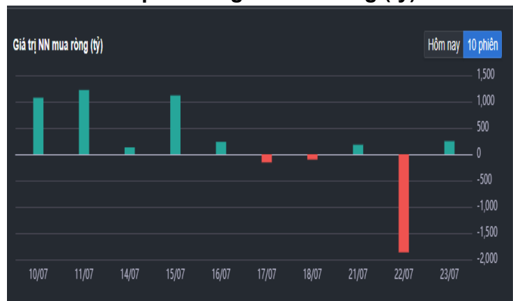
Hình 2- Giá trị Nước ngoài mua ròng (tỷ)