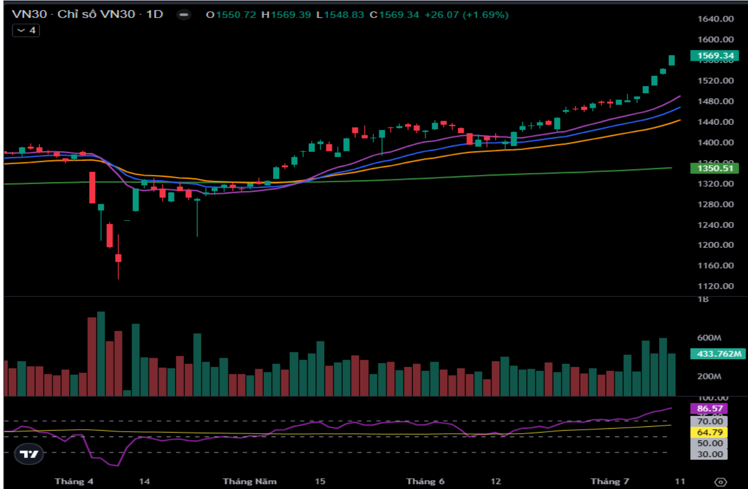
Hình 3- Chỉ số VN30 cơ sở theo ngày

Hiện tại, VN30-Index đang tiến đến gần ngưỡng Fibonacci Projection 200% (tương đương vùng 1,600-1,615 điểm). Nếu các tín hiệu tiếp tục tích cực thì đây sẽ là vùng mục tiêu giá (Price target) tiềm năng trong thời gian tới của chỉ số.