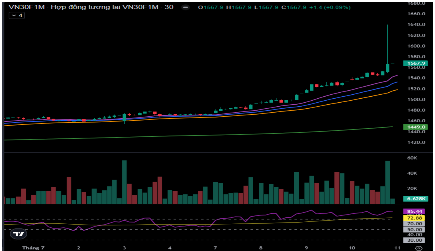
Hình 5- Chỉ số VN30F1M theo khung 30 phút