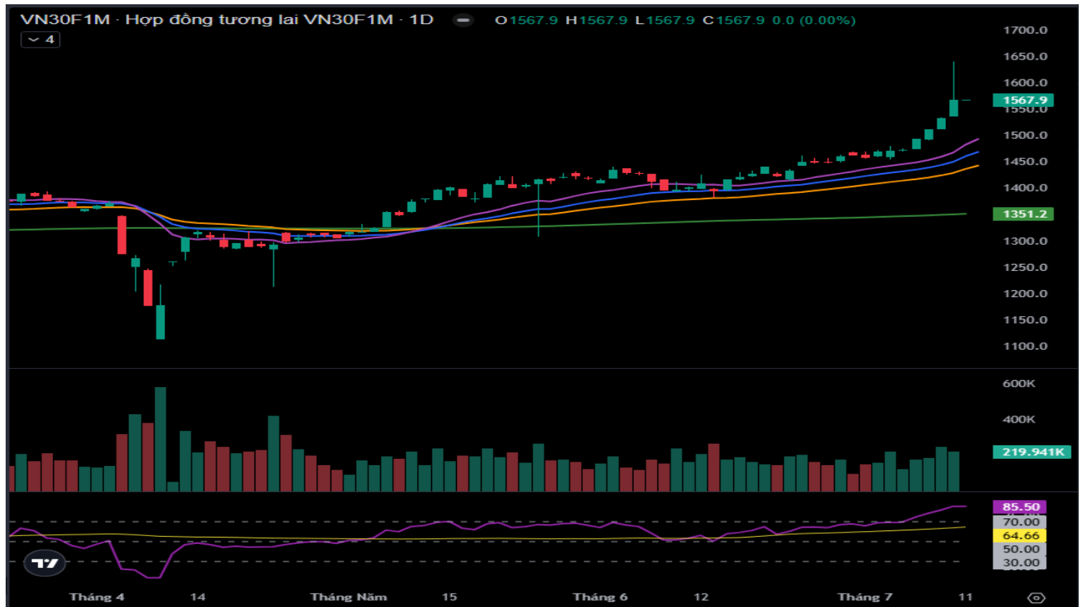
Hình 4- Chỉ số VN30F1M theo khung ngày