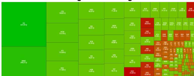
Hình 1- Phân bổ dòng tiền Nước ngoài