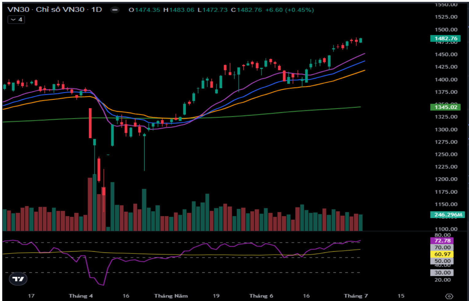
Hình 3- Chỉ số VN30 cơ sở theo ngày

Tuy nhiên, chỉ số tiếp tục hướng về ngưỡng Fibonacci Projection 161.8% (tương đương vùng 1,515-1,520 điểm) trong bối cảnh chỉ báo MACD tiếp tục hướng đi lên sau khi cho tín hiệu mua càng củng cố thêm cho đà tăng hiện tại.