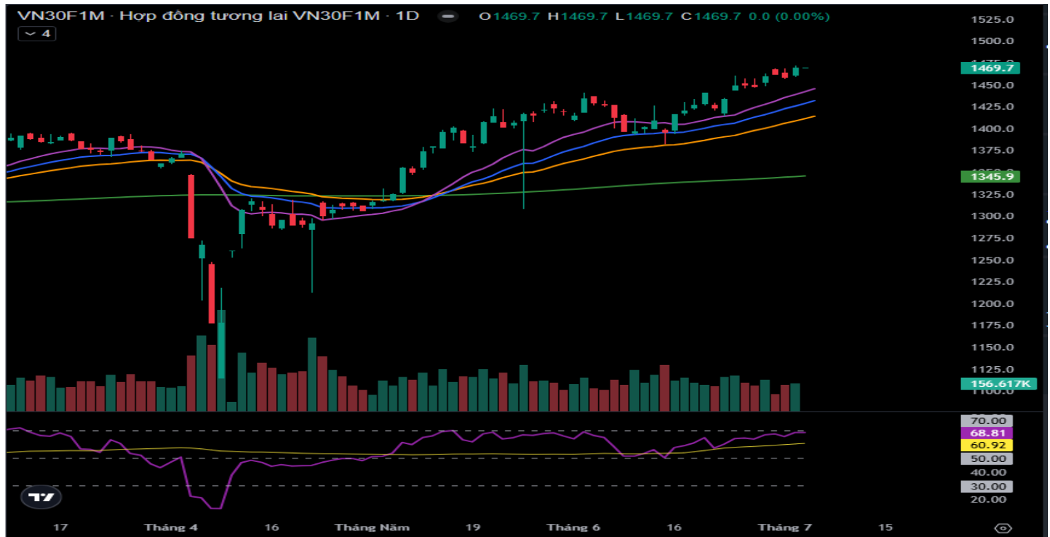
Hình 4- Chỉ số VN30F1M theo khung ngày