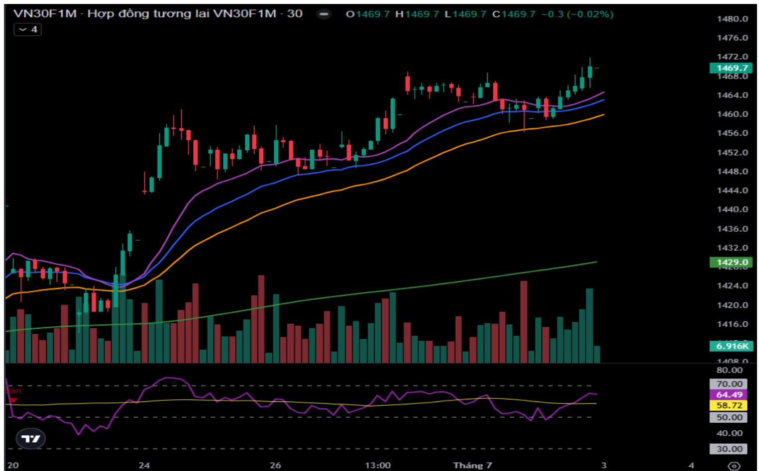
Hình 5- Chỉ số VN30F1M theo khung 30 phút