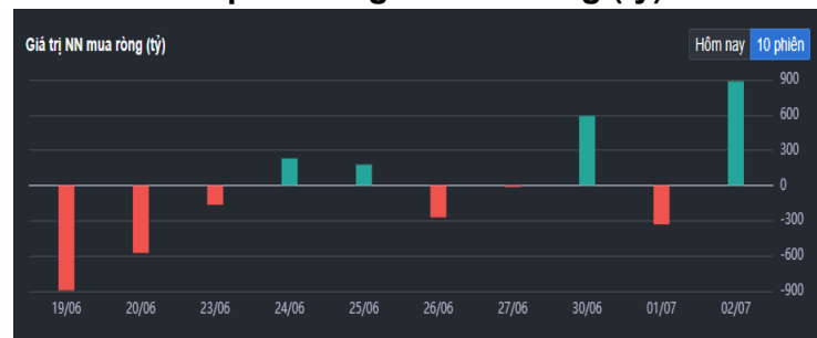
Hình 2- Giá trị Nước ngoài mua ròng (tỷ)