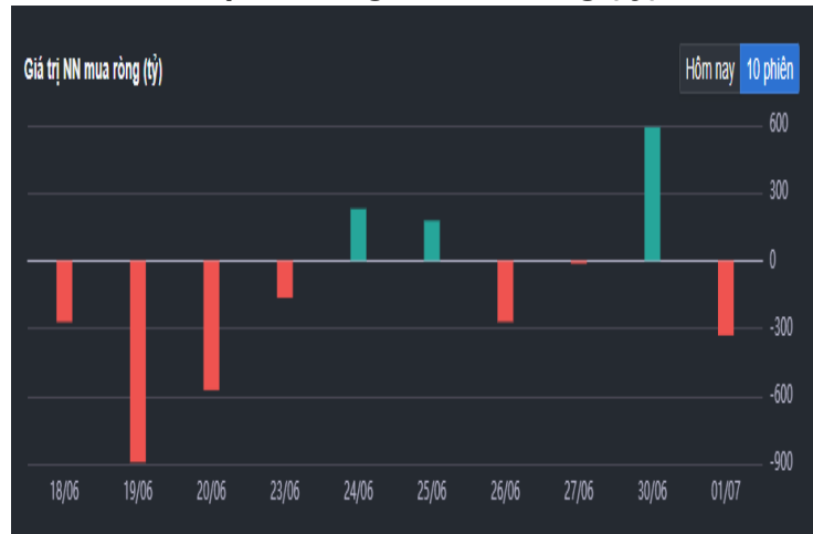
Hình 2- Giá trị Nước ngoài mua ròng (tỷ)