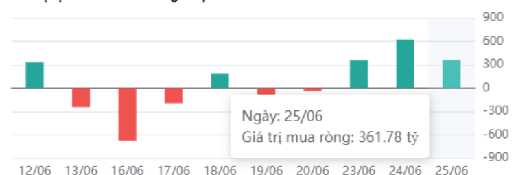
Giá trị tự doanh mua ròng 10 phiên

* Dữ liệu tự doanh được tổng hợp hàng ngày sau phiên giao dịch