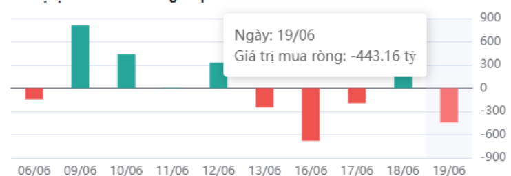
Giá trị tự doanh mua ròng 10 phiên

* Dữ liệu tự doanh được tổng hợp hàng ngày sau phiên giao dịch