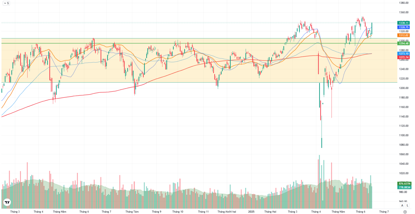
Hình 1: Đồ thị chỉ số VNIndex theo khung Daily

Chỉ số VNINDEX - 1D O 1314.05 H 1338.72 L 1313.40 C 1338.11 +22.62 (+1.72%)