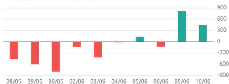
Giá trị tự doanh mua ròng 10 phiên

* Dữ liệu tự doanh được tổng hợp hàng ngày sau phiên giao dịch