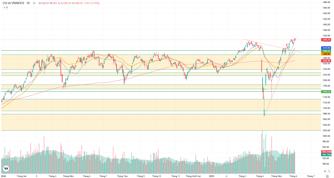
Hình 1: Đồ thị chỉ số VNIndex theo khung Daily

VN-Index kết phiên ghi nhận giảm hơn 1.5 điểm, bán xuống từ khu vực 1,351 và đóng cửa tại 1,345.71 điểm. Thanh khoản duy trì trên mức trung bình 20 phiên. Đánh giá chỉ số vượt được mốc 1,340 và đang tiệm cận đến ngưỡng 1,250 sau khi trước đó rút chân từ khu vực 1,290, đang tiến về vùng “kháng cự” 1,350 – 1,360 điểm và sự giằng co hiện hữu. Tuy nhiên, rủi ro tồn tại khi chính sách thuế quan còn nhiều biến động, quan sát phản ứng khi chỉ số về khu vực kháng cự, vùng hỗ trợ ngắn hạn quanh 1,320 – 1,330, kỳ vọng chỉ số sẽ tích lũy quanh 1,330, có thể tiệm cận về biên trên vùng 1,360 – 1,380 điểm.