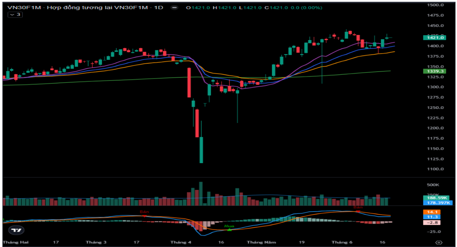
Hình 4- Chỉ số VN30F1M theo khung ngày