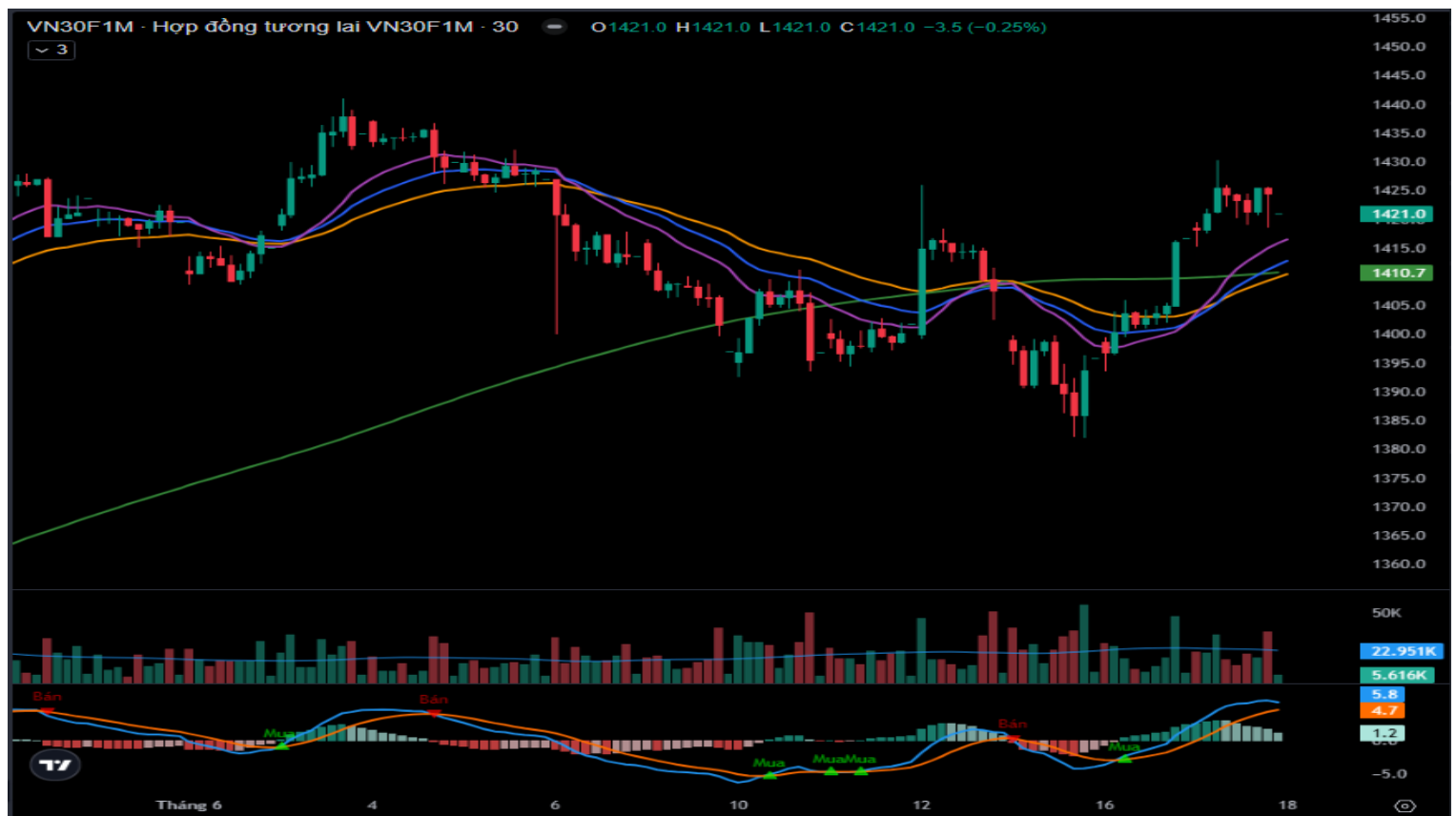
Hình 5- Chỉ số VN30F1M theo khung 30 phút