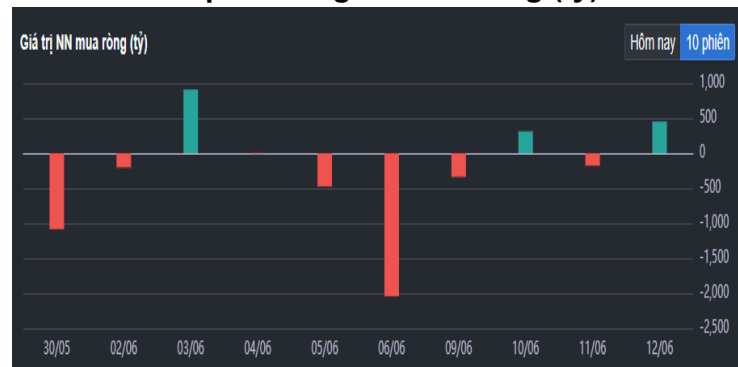
Hình 2- Giá trị Nước ngoài mua ròng (tỷ)