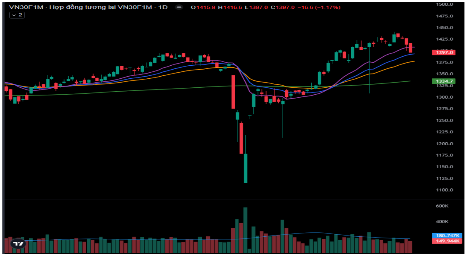
Hình 4- Chỉ số VN30F1M theo khung ngày