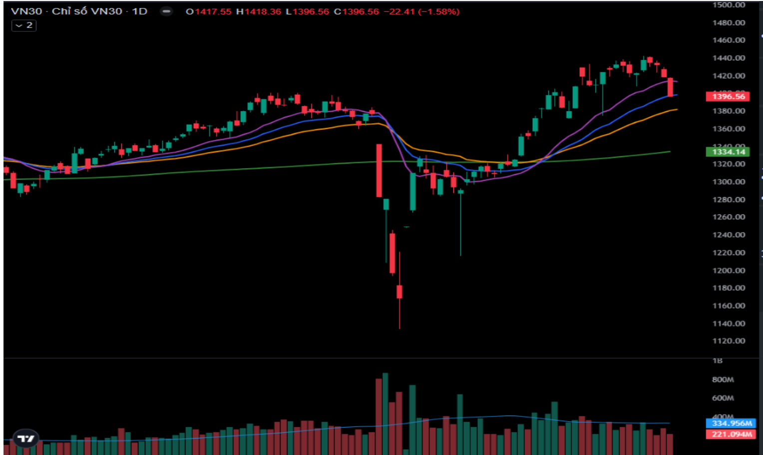
Hình 3- Chỉ số VN30 cơ sở theo ngày

Hiện tại, chỉ số đã cắt xuống dưới đường Middle của Bollinger Bands trong bối cảnh chỉ báo Stochastic Oscillator đã rơi khỏi vùng quá mua (overbought) sau khi cho tín hiệu bán. Điều này cho thấy triển vọng tiêu cực trong ngắn hạn đã xuất hiện.