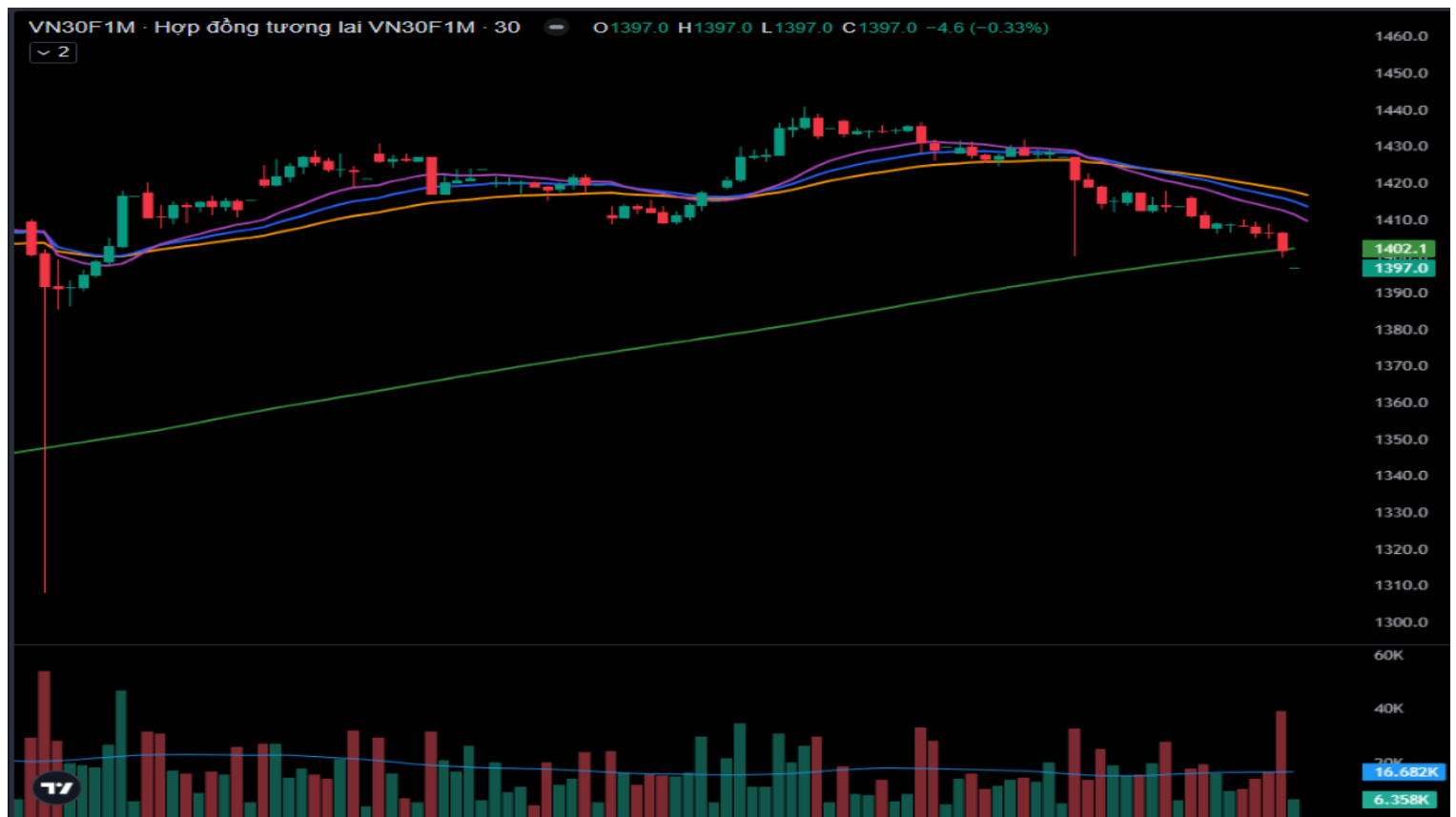
Hình 5- Chỉ số VN30F1M theo khung 30 phút