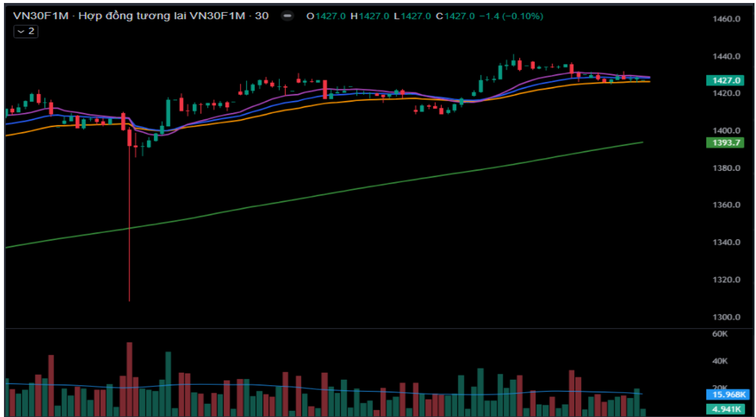
Hình 5- Chỉ số VN30F1M theo khung 30 phút