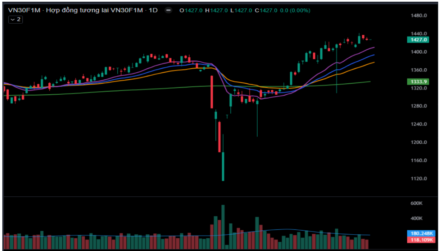
Hình 4- Chỉ số VN30F1M theo khung ngày