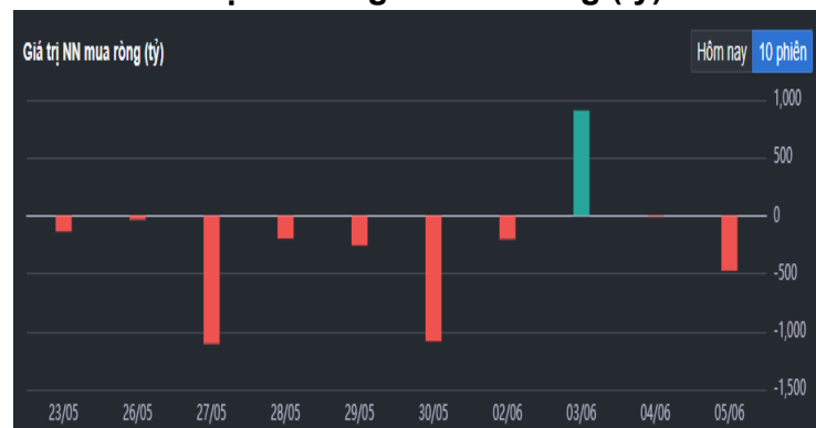
Hình 2- Giá trị Nước ngoài mua ròng (tỷ)