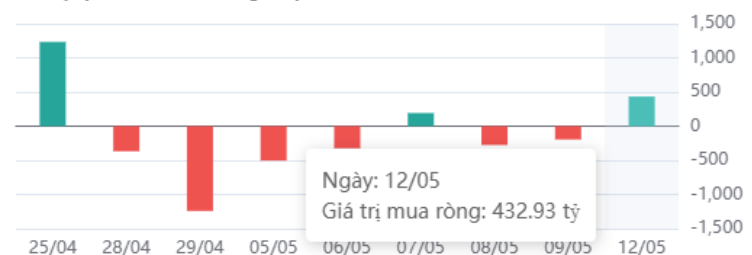
Giá trị tự doanh mua ròng 10 phiên

* Dữ liệu tự doanh được tổng hợp hàng ngày sau phiên giao dịch