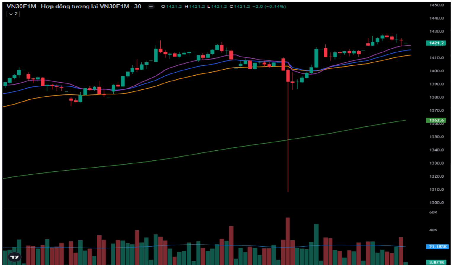
Hình 5- Chỉ số VN30F1M theo khung 30 phút