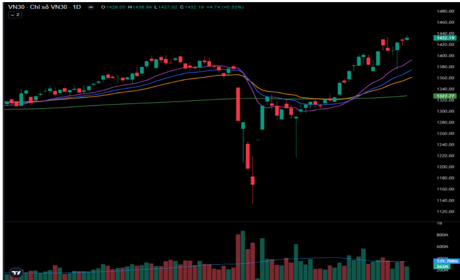
Hình 3- Chỉ số VN30 cơ sở theo ngày

Tuy nhiên, chỉ số đã lập đỉnh 52 tuần mới trong bối cảnh chỉ báo MACD vẫn đang hướng đi lên sau khi cho tín hiệu mua nên triển vọng tích cực trong ngắn hạn vẫn hiện hữu.