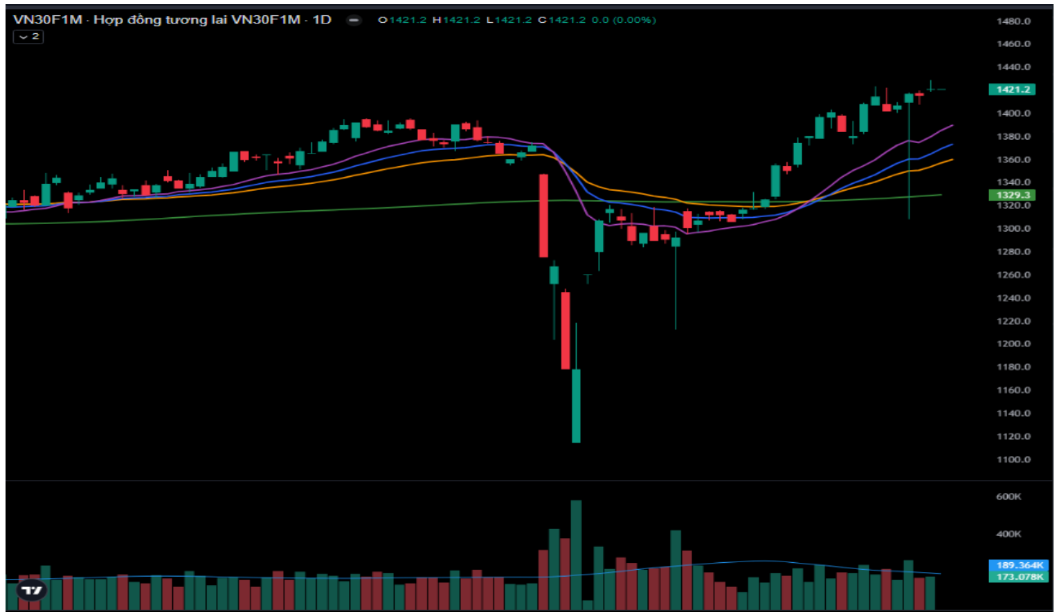
Hình 4- Chỉ số VN30F1M theo khung ngày