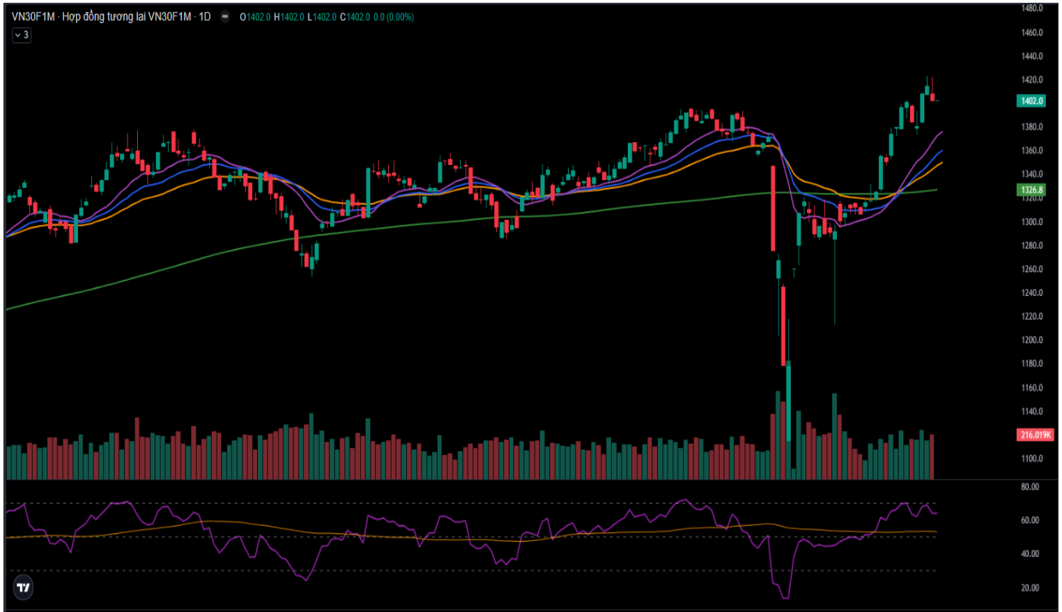
Hình 4- Chỉ số VN30F1M theo khung ngày