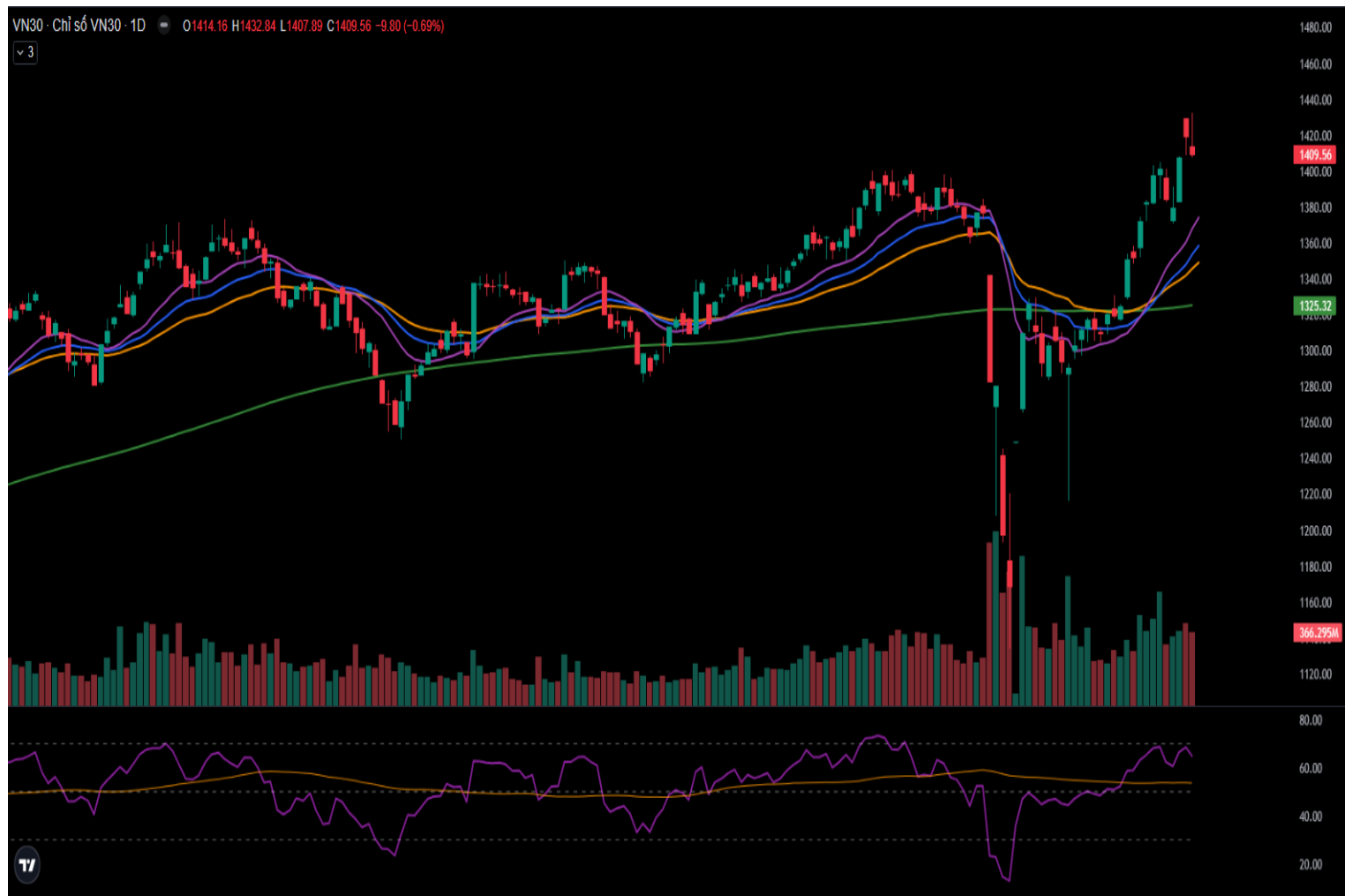
Hình 3- Chỉ số VN30 cơ sở theo ngày

Bên cạnh đó, chỉ báo ADX tiếp tục suy yếu và đang vận động trong vùng xám ( 20 < ADX < 25 ) cho thấy diễn biến đi ngang với các phiên tăng giảm đan xen có thể xảy ra trong các phiên tới.