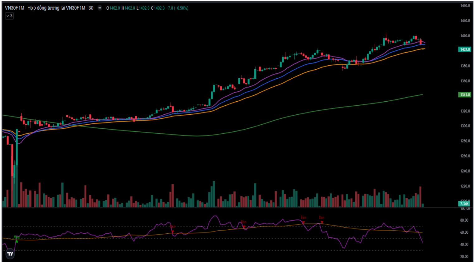
Hình 5- Chỉ số VN30F1M theo khung 30 phút