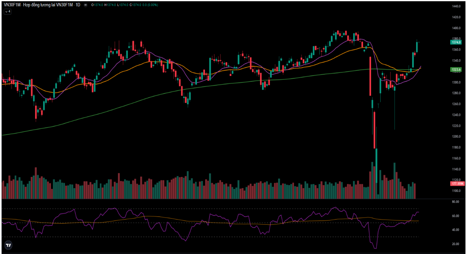
Hình 4- Chỉ số VN30F1M theo khung ngày