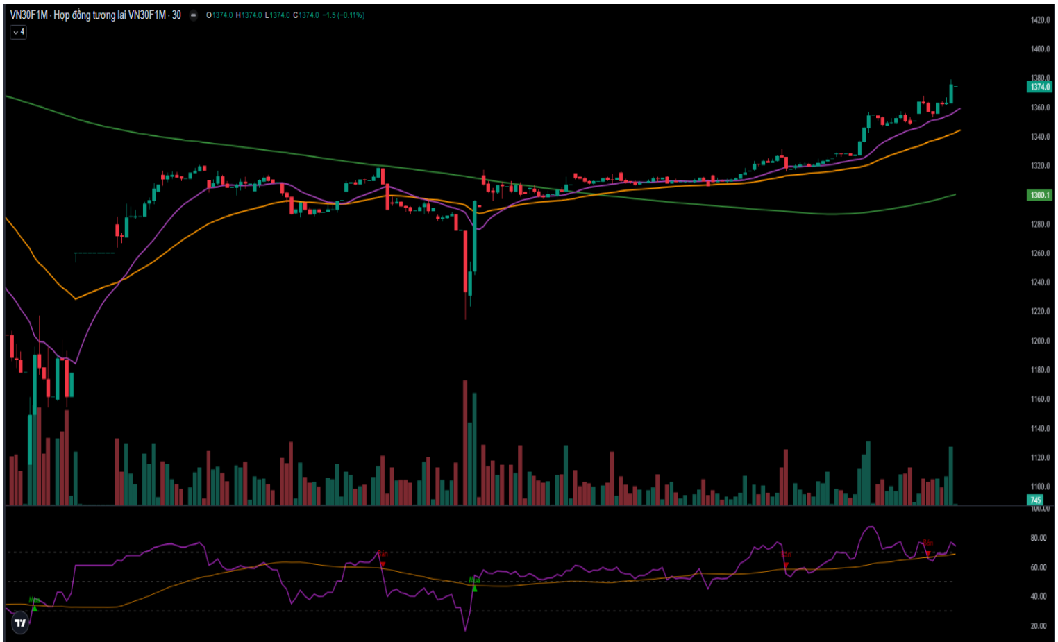
Hình 5- Chỉ số VN30F1M theo khung 30 phút